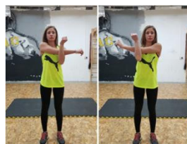
Slika 57. Vježba istezanja- m. deltoideus