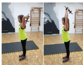
Slika 29. Potisak podlakticama bučicom - vježba za ruke (m. triceps)