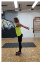
Slika 58. Vježba istezanja m. pectoralis major i m. biceps brachi