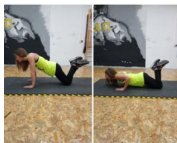
Slika 47. Sklek s koljena- vježba za prsa te ruke i rameni pojas