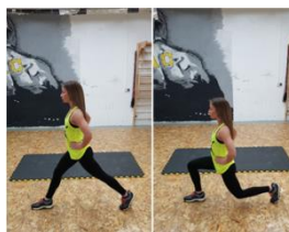
Slika 54. Iskoraci- vježba za noge