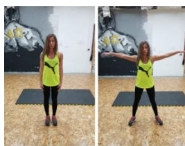
Slika 30. Jumping jack