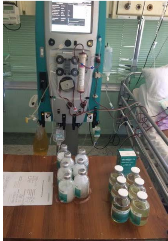
Slika 4. Mobilni stroj za kontinuirano nadomještanje bubrežne funkcije s filterom za PF, proces PF u tijeku.