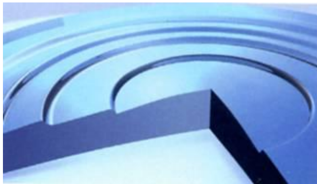
Slika 2. Apodizacija, različita visina unutar stepenica.

defokusiranu sliku obje optike, za blizu i za daleko. Apodizacija (slika 2. ) zapravo jest promjena u optici od centra leće prema periferiji. Stepenice između zona koje su u centru leće veće su što omogućuje jednaku raspodjelu svjetla između daljine i blizine. Što su perifernije, to je visina stepenica niža te je na taj način sve manje svjetla usmjereno prema blizini, a sve više prema daljini. Na taj način, kada je zjenica pri slabijem osvjetljenju široka, puno više svjetla usmjereno je ravno prema daljini. Difraktivna multifokalna leća omogućuje povećanu kontrastnu osjetljivost te bolju jasnoću slike noću te pri slabom osvjetljenju, kada je zjenica široka. Također reducira optičke fenomene noću što je posljedica spomenutog defokusiranja druge slike. Vidna oštrina na srednjoj udaljenosti katkada može biti nešto slabija.(24)