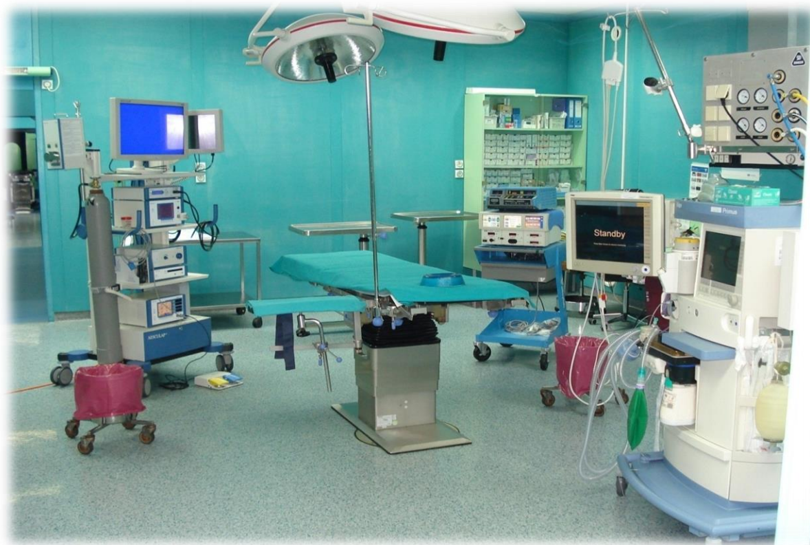
Slika 1. Operacijska dvorana