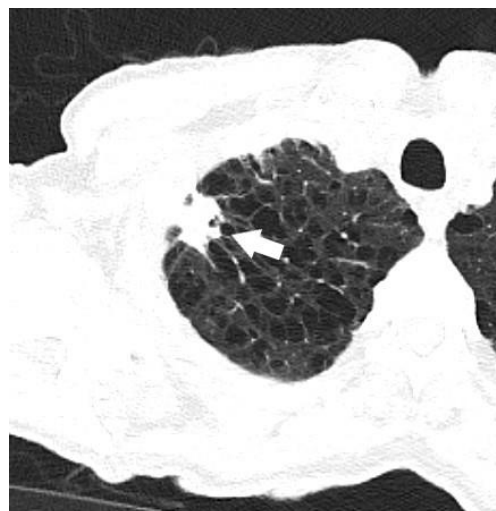
Slika 2: CT prikaz solidnog nodula spikuliranih rubova u desnom gornjem plućnom režnju (strelica). Također se izdvaja umjeren centrilobularni emfizem.

Problem koji se pojavljuje kod probira su lažno pozitivni i lažno negativni rezultati. Više je različitih faktora koji mogu utjecati na to, kao npr.: lokalizacija nodula, iskustvo radiologa, tehničke karakteristike CT-a i dr. Primjerice, noduli koji su smješteni perihilarno dijagnosticirani su sa senzitivnošću od 36.7% u odnosu na 73.9% kod onih smještenih periferno (16).