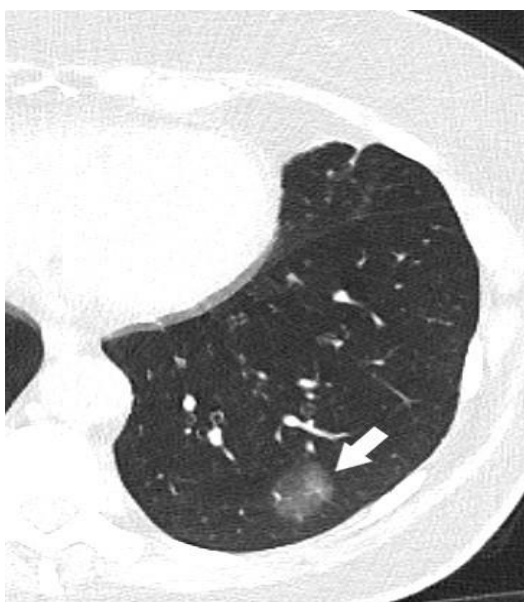
Slika 3: CT prikaz nesolidnog plućnog nodula u lijevom donjem plućnom režnju (strelica).