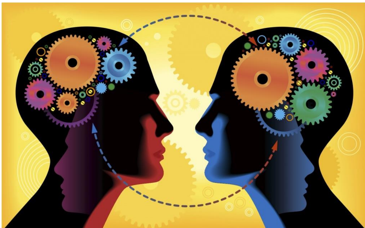
Slika 1. Empatija