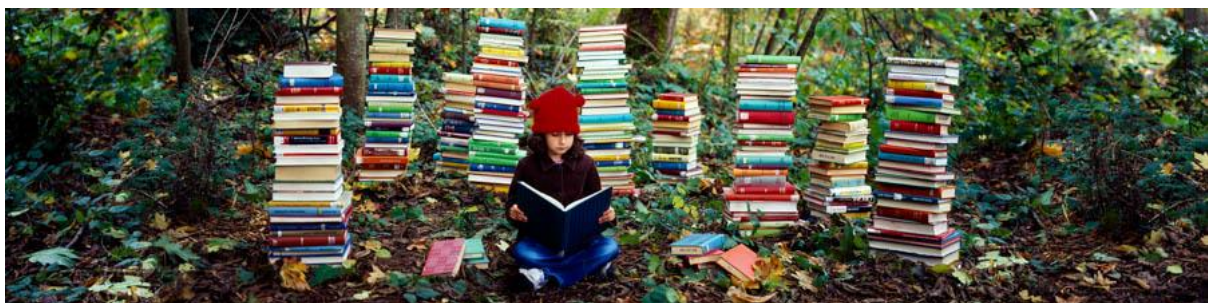
Slika 3. Poticanje kulture čitanja

Za jačanje osjećaja empatije kod djece važno je usvojiti kulturu čitanja. Danas mladi ljudi sve više gube osjećaj razumijevanja za druge, a to je u velikoj mjeri povezano s korištenjem moderne tehnologije i slabljenjem zanimanja za knjige. Čitanjem se obogaćuje naše iskustvo te potiče empatija prema likovima, pa čitači i u svakidašnjem životu imaju više empatije prema drugim osobama i bićima. U kompjuterskoj igri možete spasiti princezu da dospijete na slijedeći nivo, ali ta ista princeza u knjizi ima svoju prošlost, sadašnjost, budućnost i motivaciju i dok zamišljate događaje kroz koje ona prolazi neminovno se povezujete s njenim likom (Alexander i Sandahl, 2016).