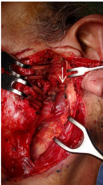
Slika 5. Modificirana incizija po Blairu s prikazanim ličnim živcem. [41] (Preuzeto:

Kirurško liječenje benignih tumora parotidne žlijezde uključuje potpuno odstranjenje neoplazme uz odgovarajući resekcijski rub kako bi se izbjegla pojava recidiva. Budući da nam patohistološka dijagnoza parotidne mase često nije poznata prije operacije, minimalna procedura koju je potrebno učiniti jest površinska parotidektomija uz očuvanje ličnoga živca što je ujedno i kurativna metoda za benigne tumore parotidne žlijezde. Pri tome je lični živac potrebno prikazati u području njegova glavnog stabla, proksimalno od žlijezde. Obično se učini modificirana incizija po Blairu koja započinje ispred heliksa uške, širi se inferiorno prema uvuli te nastavlja prema vratu paralelno s korpusom mandibule i 2 cm ispod njega. Zbog estetskih razloga može se koristiti i tzv. facelift incision . Kako bi se izbjegla ozljeda ličnog živca, operacijsko polje je prikazano široko pri čemu sternokleidomastoidni mišić i stražnji trbuh digastričnog mišića služe kao anatomska obilježja. Također, prikaže se i hrvkavični dio vanjskog zvukovoda, tragus uške i timpanomastoidna sutura kao dodatna obilježja pomoću kojih možemo prikazati ekstratemporalno stablo ličnoga živca ( slika 5 ).[41]