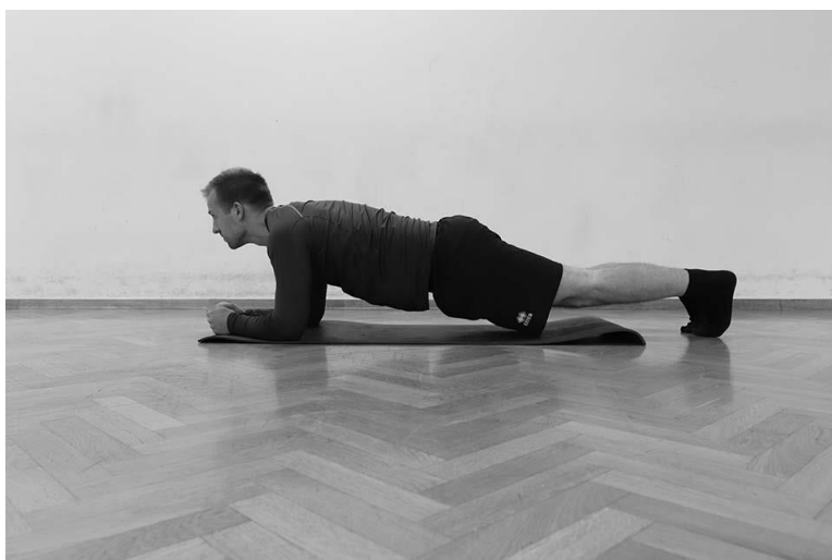
Slika 9. Izometrična vježba na laktovima u pronacijskom položaju