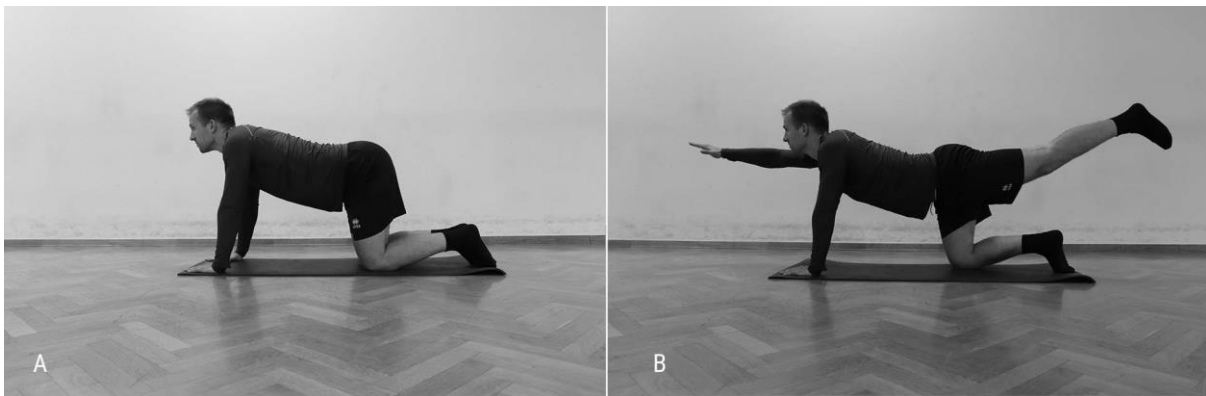
Slika 7. A. Kontrakcija abdominalnih mišića u četveronožnom položaju, B. Progresija prema istovremenom podizanju ruke i kontralateralne noge