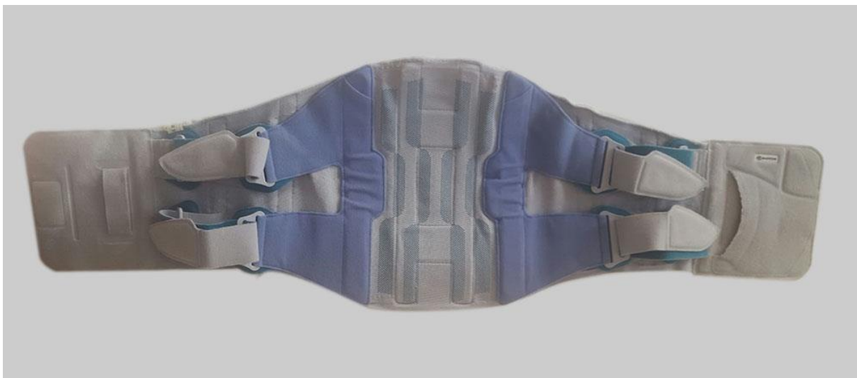
Slika 3. Medicinski pojas (ortoza) za potporu lumbalnog dijela kralježnice

(13). Bolesnik obično koristi medicinski pojas (Slika 3.) tijekom dana, koji pomaže u potpori lumbalnom dijelu kralježnice, dok ga noću pri spavanju skida. Preporučeno je sjedenje na tvrdoj i ravnoj podlozi s naslonom u trajanju ne dužem od 20 minuta u prva dva tjedna rehabilitacije (30). Potrebno je izbjegavati mekane i neravne podloge. Vožnju automobila bi trebalo izbjegavati sve do 3. ili 4. postoperativnog tjedna, ili duže, ako postoji značajan nedostatak funkcije ili osjeta u jednoj ili obje noge.