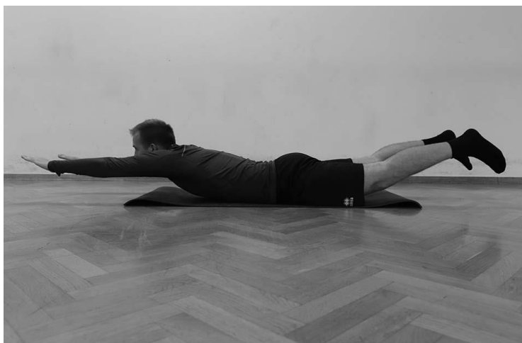
Slika 8. Položaj „ Superman “