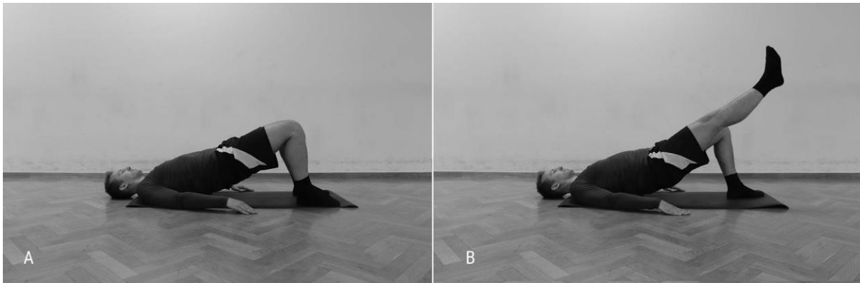
Slika 6. A. Izvođenje mosta, B. Most s jednom ekstenziranom nogom