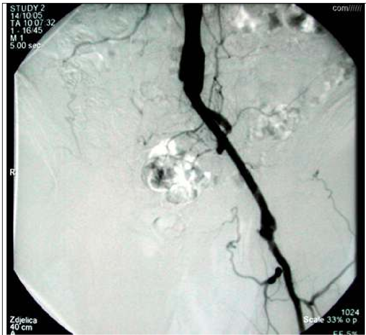
Slika 1 – Nalaz digitalne suptrakcijske angiografije u bolesnika s okluzijom desnog kraka aortobifemorale prenosnice.