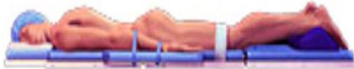
Slika 4. Pronacijski položaj

[http://wiki.med.uottawa.ca/download/attachments/7438480/PositioningBooklet.pdf?...1...]