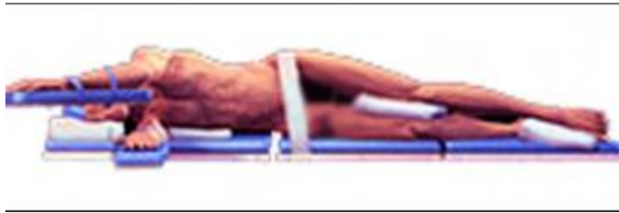
Slika 3. Lateralni ležeći položaj

[http://www.specijalna-bolnica-aksis.hr/procedure-operacije/prednja-vratna-discektomija-i-fuzija-acdf/]