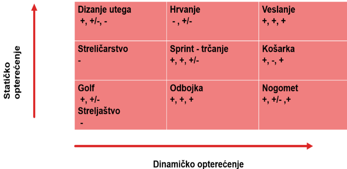
Slika 4. Na temelju analize studija u ovom radu, vidljivo je da je učinak kofeina na sportsku izvedbu najčešće prisutan u sportovima s visokim dinamičkim opterećenjem.

+ - pozitivan učinak kofeina na sportsku izvedbu, - - negativan učinak, +/- - učinak pozitivan samo u nekim ispitivanim segmentima