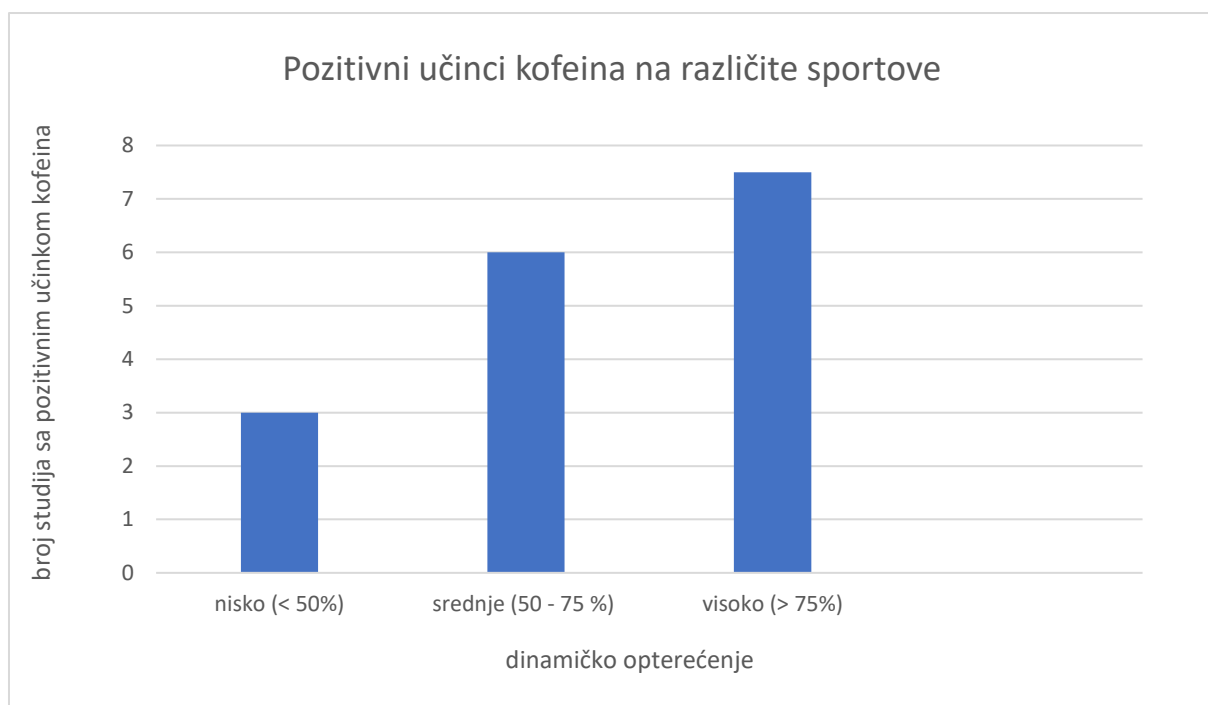
Slika 5. Grafički prikaz broja studija s potvrđenim pozitivnim učincima kofeina u ovisnosti o razini dinamičkog opterećenja u sportu ispitivanom u pojedinoj studiji