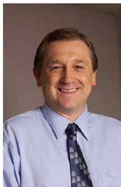
NCI Bethesda, 2002 Head, GVHD and autoimmunity