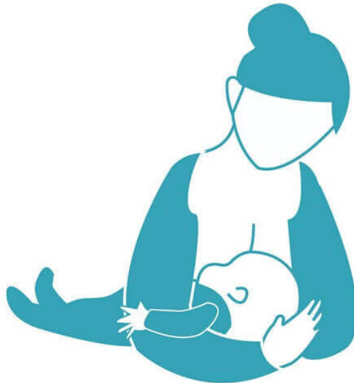
Majka doji dijete u položaju „nogometne lopte“(9)

Dijete se stavlja majci na bok i drži ga se između boka i ruke. U dlanu svoje ruke drži djetetovu glavicu, a leđa podupire podlakticom, noge su usmjerene prema majčinim leđima, a usta djeteta su u visini bradavice. Ispod djeteta se stavi jastuk kako bi dijete bilo u pravoj visini i nosićem moglo dotaknuti bradavicu.