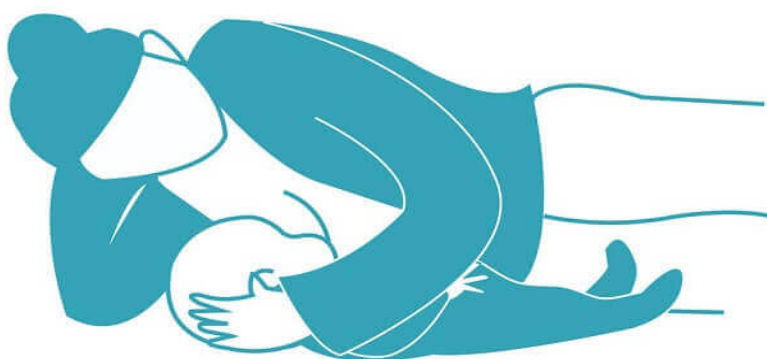
Majka doji dijete u bočno ležećem položaju (9)

Majka leži na boku stranom dojke koja doji, iza leđa se postavi nekoliko jastuka te jedan ispod glave i ramena kako bi leđa i bokovi bili ispravljeni u ravnini. Beba je u ovom položaju okrenuta prema majci, gornja majčina ruka drži dlanom bebinu glavu, a donja ruka je ispod majčine glave kako ne bi smetala. Najpovoljniji je položaj u prvim danima nakon poroda i za noćne podoje.