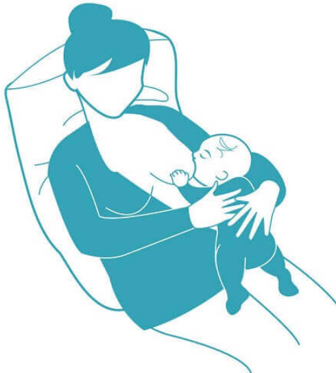
Majka koja doji u ležećem položaju (9)

Dojenje na leđima još se naziva i biološkim dojenjem. U tom položaju majka je na leđima, a dijete na njoj. Svaki dio djetetova tijela okrenut je prema majci i dodiruje je te se naslanja na prirodne krivulje majčina tijela. Ovaj položaj nije isključivo položaj za dojenje udoban za majke. Položaj je dobar kod majki koje se oporavljaju od epiziotomije, majki s manjim grudima te kod majki koje se bore s prejakim refleksom otpuštanja mlijeka. Savjetuje se i kod beba kojima je dijagnosticiran skraćeni frenulum.