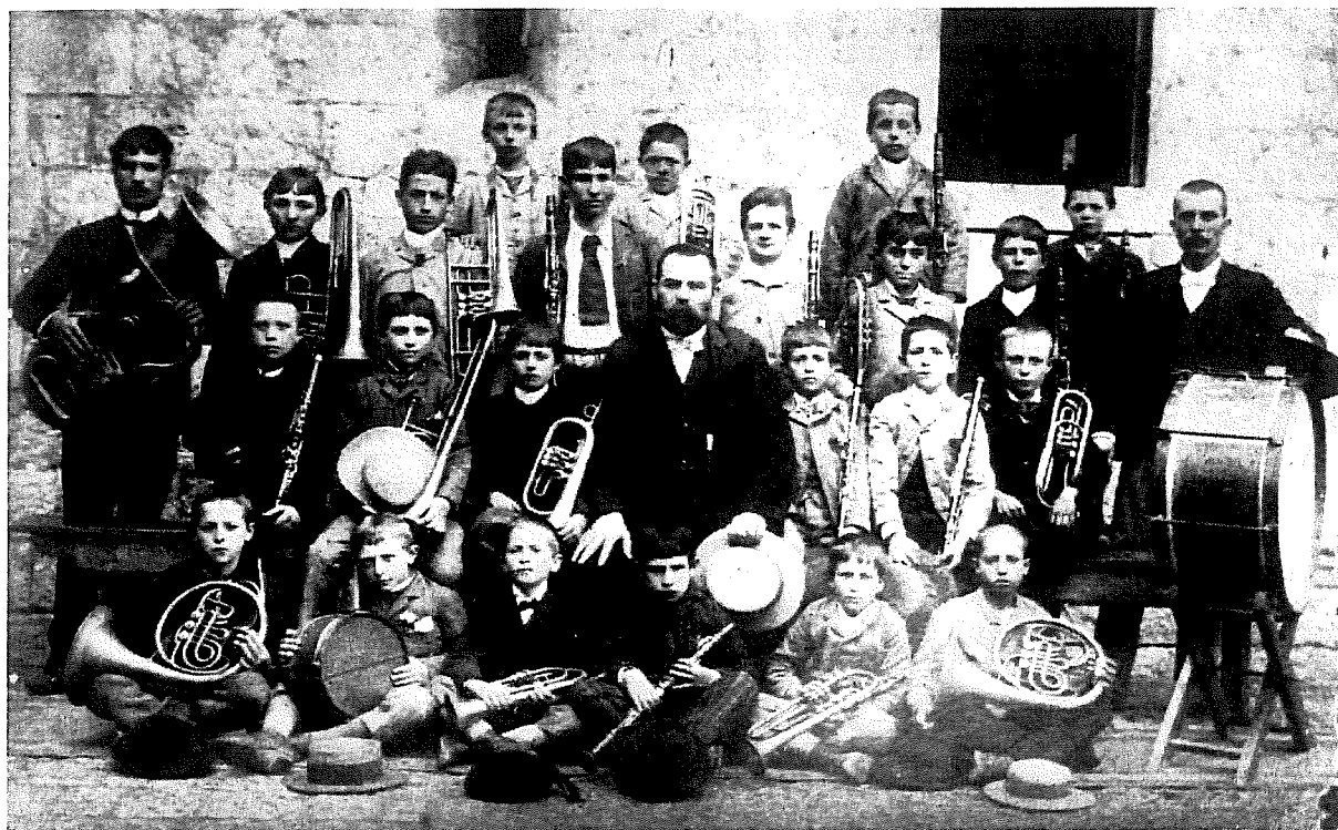
1890. - NAJSTARIJI SNIMAK VIŠKE GLAZBE (TAJ JE SASTAV 1893. BIO NA PROSLAVI OTKRIĆA SPOMENIKA GUNDULIČU U DUBROVNIKU.

jednoj knjizi objedine kako sjećanja, tako pisane spomenice djelovanja ovog starog amaterskog kulturnog društva, bilo je ključno srediti Arhiv Glazbe iz čega se rodila i spomenuta monografija iz koje navodim kronologiju povijesti ovog Društva.