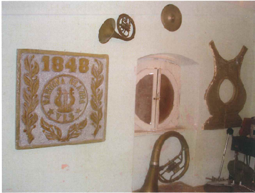
Dokument Arhiva. Arhivska oznaka: 1978/3