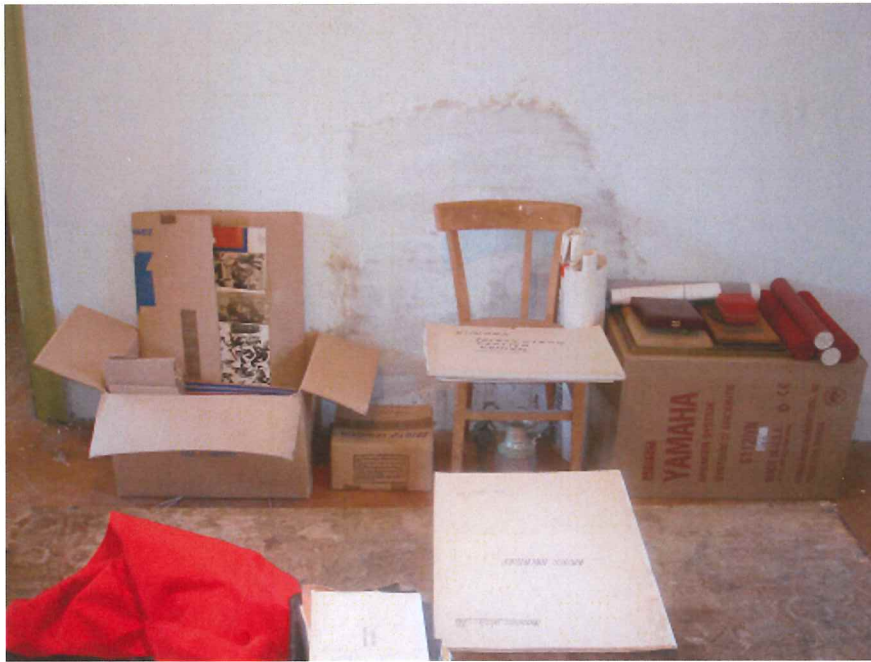
Inventar Hrvatske gradske glazbe Vis