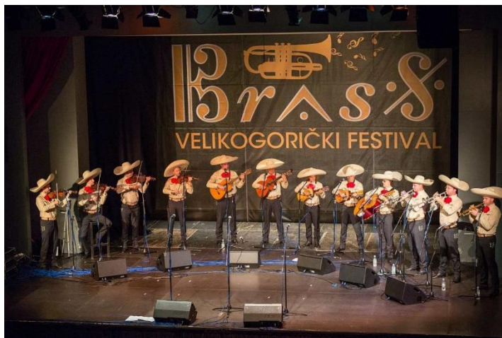
Slika 15 Mariachi Los Caballeros na Velikogoričkom Brass festivalu 2017. godine

Također i ove godine Festival pokušava proširiti vidike publike o limenim puhačkim instrumentima pa tako dovodi i vodećeg glasnogovornika mariachi glazbe u hrvatskoj, sastav Mariachi Los Caballeros . Od svog prvog koncerta 1998. godine u Kino klubu Zagreb postali su jedan od najuglednijih ambasadora mariachi glazbe izvan španjolskog govornog područja.