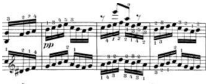
Slika 19: Zadnja pasaža šesnaestinki u codi

Zadnju tehničku problematiku koju je vrijedno spomenuti nalazimo nakon višeglasja spomenutih u prethodnom paragrafu.