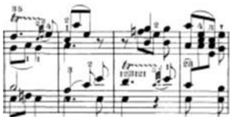
Slika 18: Dvoglasje unutar lijeve i unutar desne ruke u kombinaciji sa trilerima

U codi nalazimo dvije problematike. Prva problematika se nalazi u prvoj polovici code i to je sviranje dva glasa jednom rukom ali uz to su i dodani trileri. Dakle, u 332., 334. i 336. taktu jedna ruka mora u isto vrijeme svirati triler i drugi glas.