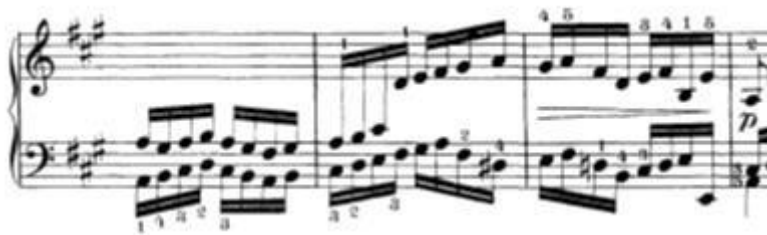
Slika 13: Niz šesnaestinki koje se kreću istovremeno u dva glasa

Predložio bih da se vježba na dva načina: prvi način je vježbanje u sporom tempu u kojem se osigurava čistoća tonova i uvježbava amplituda pokreta. Drugi način je takozvano „nijemo“ vježbanje u kojem je funkcija usmjerena na pokret. Nakon što je prvi ton odsviran, ruka najvećom brzinom skače i zaustavi se nad drugom notom (u ovom slučaju oktavom).