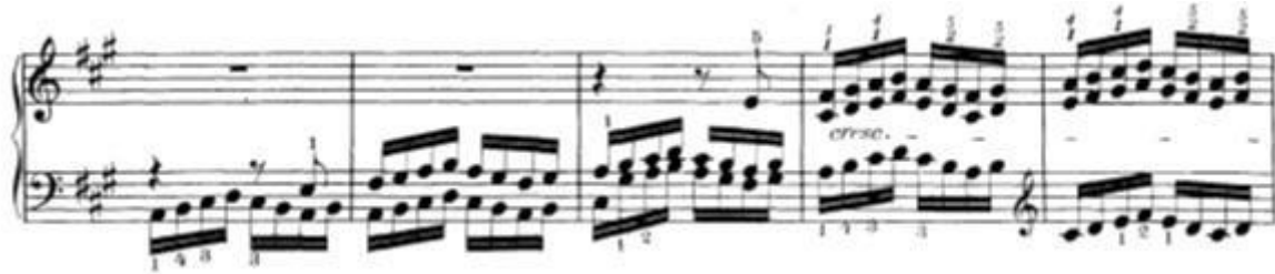
Slika 14: Niz šesnaestinki koje započinju u jednom glasu, zatim se dodaje drugi glas i na kraju još treći glas. U troglasju desna ruka svira paralelno kvarte kao gornji i srednji glas

Najveća tehnička problematika cijelog stavka po mom mišljenju je u prije spomenutim paralelnim sekstakordima. Ovdje nalazimo najveću problematiku jer desna ruka mora odsvirati niz paralelnih kvarti u legatu .