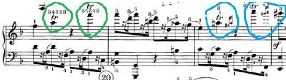
Slika 10: Prikaz trilera iz prvog djela

Drugo mjesto nalazi se u triu stavka u 76. taktu. Tamo se nalazi samo jedan triler ali on nije u funkciji ukrasa nego je duži (traje tri takta).