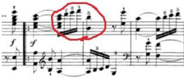
Slika 12: Početak prve teme četvrtog stavka.

Predložio bih da se vježba na dva načina: prvi način je vježbanje u sporom tempu u kojem se osigurava čistoća tonova i uvježbava amplituda pokreta. Drugi način je takozvano „nijemo“ vježbanje u kojem je funkcija usmjerena na pokret. Nakon što je prvi ton odsviran, ruka najvećom brzinom skače i zaustavi se nad drugom notom (u ovom slučaju oktavom).