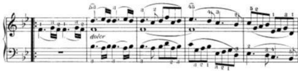
Slika 3: Početak tria – prva dva takta služe kao uvod, zatim dolazi prva tema tria

Odmah nakon slijedi druga tema (t.60-64) koja je u F-dur tonalitetu kao dominantna za B-dur. Cijela druga tema se odvija u kanonu kao nastavak kanona s kraja prve teme. Dalje dolazimo do razvojnog djela (t.65-76) koji započinje istim motivom kao završetak prve teme (t.58 i 59). Cijeli razvojni dio se također vrši kanonskom tehnikom kao i kraj prve teme i cijela druga tema. U 76. taktu ponavlja se prva tema u B-duru ali s dodanom pratnjom u vidu trilera. Kao i prvi puta, nakon završetka prve teme nastavlja druga tema (t.79-83) koja se kreće na isti način kao prvi puta s jednom razlikom da je druga tema u B-duru dok je prvi puta bila u F-duru. Nakon druge teme se u 84. taktu opet pojavljuje motiv iz uvoda B djela (t.55 i 56) koji se kroz istu ritmiku proširuje sve do 91. takta. Ovaj dio se može smatrati kao prijelaz na ponovljeni A dio jer je došlo do modulacije u F-dur. To se primjećuje kroz akorde C-dura koji su napisani u funkciji dominante za F-dur. Još očitije se pokazuje prijelaz na A dio u zadnja četiri takta (t.91-94). Ta četiri takta su gotovo u potpunosti jednaka taktovima 36-39 gdje se drugi dio teme vrši u gornjem glasu dok ju donji glas prati pedalnim tonom C. Razlika je u samom kraju odnosno u zadnja dva takta. U A djelu su ta dva takta ostala na dominantni (C) dok se u B djelu zadnja dva takta rješavaju na toniku (F). Tu završava B dio i dolazi do povratka u A dio ( da capo ) koji se izvodi do kraja bez ponavljanja.