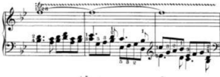
Slika 11: Prikaz dužeg trilera iz drugog djela odnosno "triu"

Drugo mjesto nalazi se u triu stavka u 76. taktu. Tamo se nalazi samo jedan triler ali on nije u funkciji ukrasa nego je duži (traje tri takta).