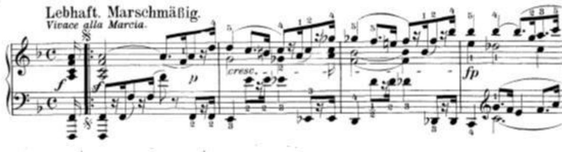
Slika 2: Početak drugog stavka

Prvi dio odnosno A dio (t.1-54) je u dvodijelnom obliku (a b). Prvi dio (a, t.1-11) čini tema koja traje 8 taktova. Nakon 8. takta dolazi do ponavljanja. Prvi puta tema koja započinje u F-duru modulira u C-dur dok se drugi puta tema nakon 8.takta proširuje i kroz to vanjsko proširenje vraća u F-dur tonalitet.