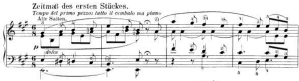
Slika 5: Ponovni nastup prve teme prvog stavka nakon kadence u trećem stavku

Nakon kadence u trećem stavku Beethoven iznenaduje pojavom prve teme prvog stavka (t.21-24). Ovo je bilo vrlo značajno za Beethovenovo kasnije stvaralaštvo. Uzmimo za primjer njegovu devetu simfoniju: na početku četvrtog stavka simfonije dolazi do reminiscencije motiva/fraza iz prethodnih stavaka.