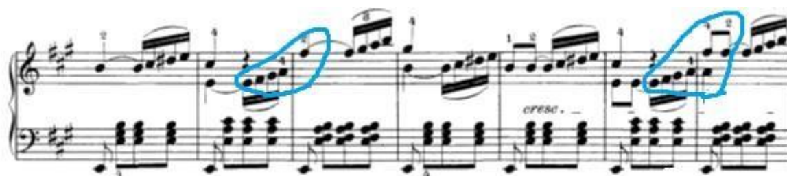
Slika 15: Početak završnog djela u ekspoziciji. Slična problematika sa skokovima kao u prvoj temi četvrtog stavka

Sljedeća problematika pojavljuje se u završnom djelu i u ekspoziciji i u reprizi. Problem je u skokovima na novu poziciju iz jedne šesnaestinke na sljedeću u naznačenim mjestima.