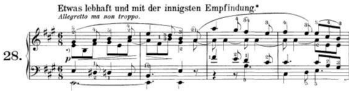
Slika 1: Prva tema prvog stavka sonate

Stavak je skladan u sonatnom obliku u tonalitetu A-dura. Najveća zanimljivost ovog stavka je da ne potvrđuje A-dur tonalitet unutar početka ekspozicije. Tema se izlaže odmah na početku kroz prva četiri takta ali ta tema počinje i završava na dominantanti (u E-duru).