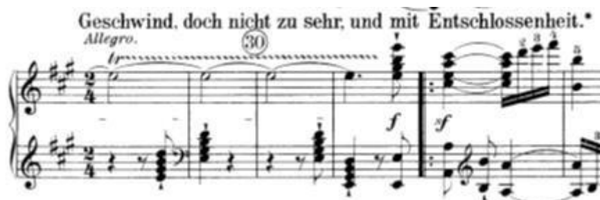
Slika 6: Uvod za prvu temu u četvrtom stavku

Prva tema (t.33-65) je dugačka (traje 32 takta). Cijela prva tema zapisana je u repriznom obliku. Inače se reprizni oblik koristi u dvodijelnoj pjesmi i rijetko se koristi unutar sonatnog oblika, no Beethoven ga je odlučio iskoristiti za prvu temu. Prva tema sastavljena je od dva dijela. Prvi dio (t.33-48) čini velika perioda (a-a'), u kojoj prva rečenica (t.33-40) kadencira na dominantu a druga (t.41-48) u tonici. Drugi dio (t.49-65) je niz rečenica u kojem prva rečenica (b, t.49-56) donosi kontrast dok druga rečenica odnosno repriza (57-65) donosi materijal iz prvog djela sa sitnim izmjenama (a'') koja završava u osnovnom tonalitetu (A-dur). Većina prve teme odvija se u kanonu.