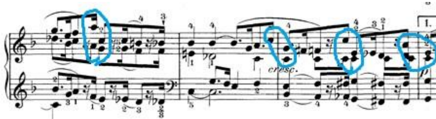
Slika 8: Skokovi unutar punktiranih nota

U ovom stavku prevladava motiv punktirane note. Punktirane note kao jedna melodijska linija ne predstavlja velike tehničke probleme, no u ovom stavku nalazimo dvohvate i akorde koji se kreću u nizu punktiranih nota. Zašto je to problem? Zato što su na nekoliko mjesta zapisani nezgodni skokovi iz šesnaestinke prethodnog para punktiranih nota na osminku sljedećeg para punktiranih nota.