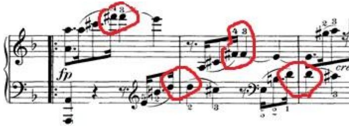
Slika 9: Prikaz repeticija

Kao što sam bio spomenuo, u većini stavka prevladava motiv punktiranih nota. U nekoliko navrata zadnja nota prethodne punktirane note se ponavlja na sljedeću prvu notu.