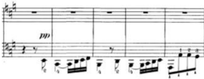
Slika 7: Tema fuge odnosno provedbe četvrtog stavka

Prvih 9 taktova služe kao uvod u fugu. Unutar tog uvoda smiruje se sva razigranost iz ekspozicije i dolazi do modulacije u a-mol - tonalitet u kojoj se odvija četveroglasna fuga. Fuga započinje temom u basu u a-molu (dux, t.123-130).