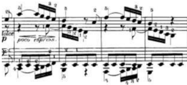
Slika 17: Početak prve teme u reprizi četvrtog stavka

U prvoj temi u reprizi (t.240-243) ponovno se pojavljuje problematika sviranja dva glasa jednom rukom što znači da bih i ovdje preporučio vježbanje svakog glasa posebno pravilnim prstometom, zatim odsvirati posebno lijevu i desnu ruku budući da svaka ruka ima dva glasa za svirati i tek zatim sve zajedno.