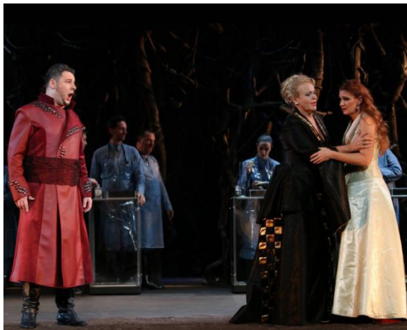
Slika VI: Opera Nikola Šubić Zrinjski u produkciji HNK Ivana pl. Zajca u Rijeci