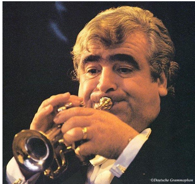
Slika 9 Maurice André

Festival 2013. godine je u znak sjećanja posvećen životu i djelima jednog od velikana trubačkog svijeta, Mauriceu Andréu (1933 – 2012.), francuskom trubaču koji je bio aktivan na području klasične glazbe. Kao profesor djelovao je na konzervatoriju National Supérieur de Musique u Parizu, a svojim sviranjem nadahnuo je mnoge kolege iz svoje struke diljem svijeta.