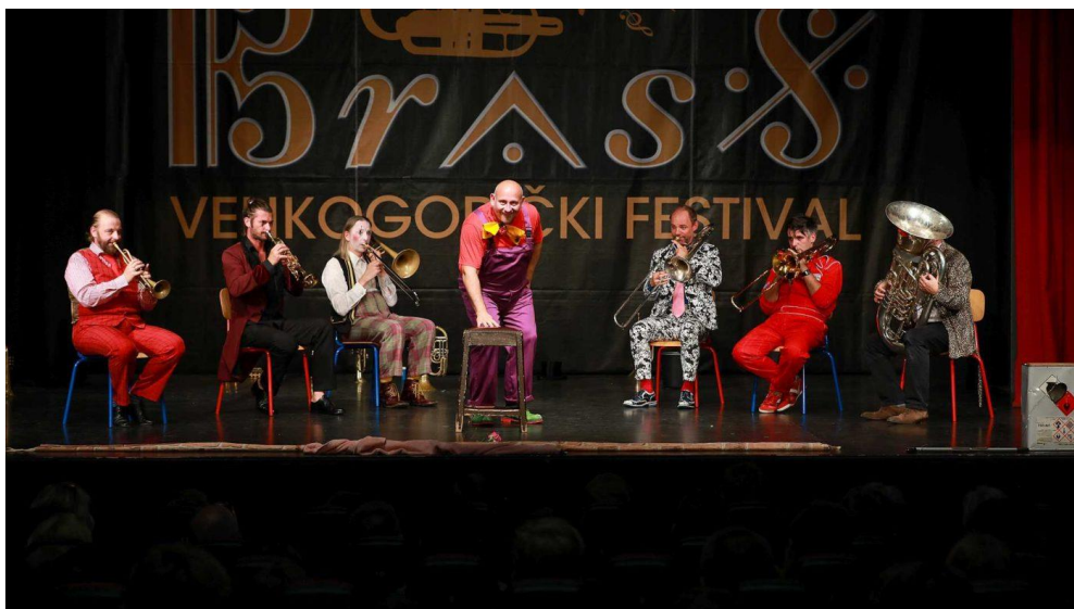
Slika 16 Mnozil Brass na Velikogoričkom Brass Festivalu 2018. godine

Festival ove godine otvara jedan od najpoznatijih komornih sastava limenih puhača Mnozil Brass. Ovaj sastav na sceni djeluje od 1992. godine, a svake godine odsviraju oko stotvadeset koncerata. Sviraju glazbu iz svakodnevnog života i prihvatljivu svakoj publici. Posebni su i po tome što svoju izvedbu upotpunjuju i scenskim nastupom.