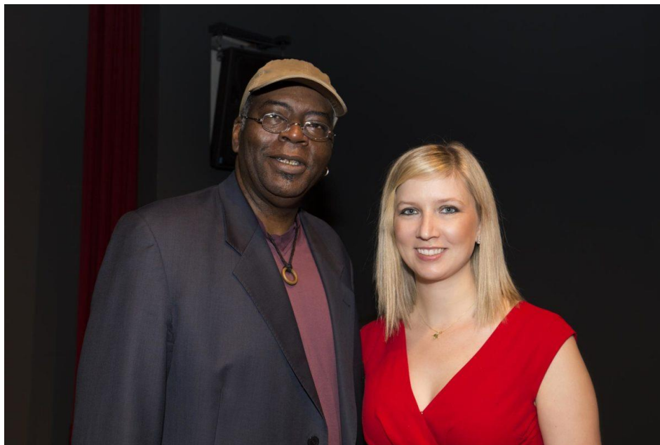
Slika 12 Jon Sass i Mary Elizabeth Bowden na Velikogoričkom Brass Festivalu 2015. godine

Na svečanom otvorenju Festivala 2015. godine, koji je posvećen preminulom trubaču Stanku Selaku, nastupa amerikanka Mary Elizabeth Bowden (truba) uz pratnju Simfonijskog puhačkog orkestra Oružanih snaga Republike Hrvatske. Članica je Richmondskog simfonijskog orkestra i Des Moines Metro Opera orkestra, a diplomirala je na The Curtis Institute of Music i Yale School of Music . Svečani koncert upotpunio je, također kao solist, i tubist Jon Sass koji odrasta u New Yorku te je često na turnejama i jedan od rijetkih tubista koji stvara svoju vlastitu glazbu te se bavi multimedijalnim projektima.