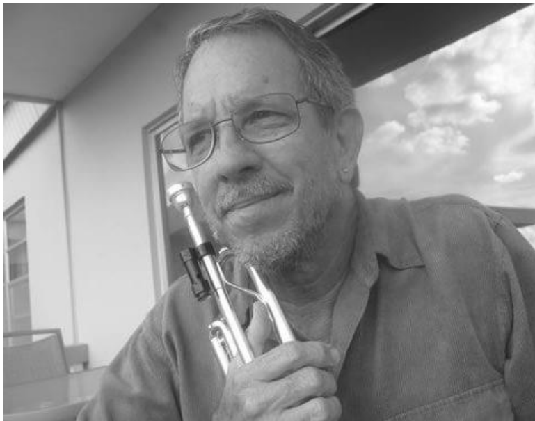
Slika 20 Charles Reskin

Počasni gost te godine je Charles Reskin (1946.). Charles svoju glazbenu karijeru započinje kao udaraljkaš no ubrzo ga privlači i truba. Za vrijeme školskih dana svirao je oba instrumenta i surađivao s profesionalnim orkestrima te je uz to pohađao i privatne satove teorije glazbe i dirigiranja na Sveučilištu u Miamiu. Nakon mature upisuje Julliard School of Music, prvo kao timpanist, a kasnije kao trubač u klasi profesora Williama Vacchiana. Njegove skladbe izvođene su svake večeri u programima Festivala no potrebno je naglasiti kako je njegova skladba Three Gestures na 13. Festivalu imala i europsku premijeru.