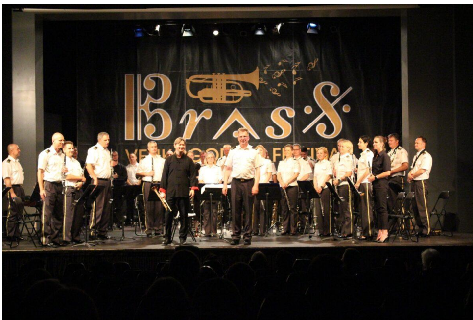
Slika 22 Sergei Nakariakov na Velikogoričkom Brass Festivalu 2021. godine

Kako je deveti po redu Festival bio posvećen ruskoj trubačkoj legendi Timofei Dokshitzeru tako 2021. godine na festivalu možemo čuti njegov utjecaj u izričaju Gennady Nikonova, a također i vidjeti kako je preko medija nosača zvuka utjecao na nekada dijete, a danas etabliranog i cijenjenog umjetnika Sergei Nakariakova (1977. – ). Sergei je izraelsko-ruski trubač koji svoj prvi CD snimak objavljuje 1992. godine sa svojih petnaest godina. Nakon ozljede kralježnice je trubom morao zamijeniti svoj primarni instrument klavir. U samo godinu dana rada na tehnici sviranja trube sa svojim ocem prosvirao je sva poznatija djela s repertoara. Na Festivalu je nastupio u pratnji orkestra Oružanih snaga Republike Hrvatske pod ravnanjem dirigenta Miroslava Vukovojca Dugana.