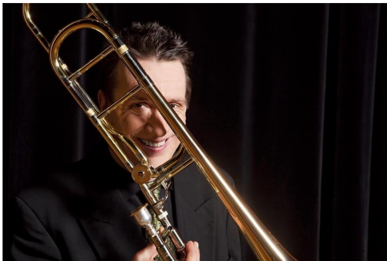
Slika 8 James C. Lebens

Jedan od počasnih gostiju festivala je i proizvođač usnika Karl Breslmair. "Proizvođač Karl Breslmair stoji na usluzi za odgovore na sva pitanja o proizvodnji usnika za amatere, ljubitelje glazbe, znatiželjnike, te za isprobavanje novih usnika i pomoć u pronalasku „onog pravog“ za profesionalce." (Špoljar, VGBRASS, 2022.) Uz izložbu usnika, u sklopu Festivala i u suradnji s kvintetom Simply Brass, majstorski tečaj drži američki trombonist, dirigent i pedagog James C. Lebens.