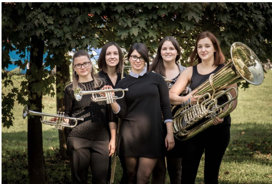
Slika 17 Tubismo Brass Kvintet

Tomislav Špoljar piše: "Jedan od prvih Festivala bio je posvećen damama u svijetu limenih puhača. Tada su umjetnice koje ćemo imati prilike slušati 27. svibnja bile studentice i učenice te su Festival posjećivale s otvorenim ušima, očima i srcima, a danas sačinjavaju mladi, ali već afirmirani ansambl koji se može podičiti s nekoliko značajnih nastupa." (Špoljar, VGBRASS, 2022.) Ansambl o kojem Tomislav piše je Tubismo Brass Kvintet i djeluje od 2016. Godine. Ovaj kvintet je prvi ženski brass kvintet u Hrvatskoj.