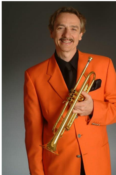
Slika 5 Allen Vizzutti

Iz programa te godine možemo zaključiti kako festival sluša svoju publiku te organizacija festivala daje pozornost svakom detalju kako bi užitek publike bio potpuniji. Festival dovodi rezidencijalnog umjetnika festivala 2011. godine, Allena Vizzuttija kako bi nastupio uz Big Band Hrvatske Radio Televizije i Jazz orkestrom hrvatske mladeži Zagreb (HGM jazz orkestar Zagreb). Allen Vizzutti (1952.) je američki trubač, skladatelj i profesor. Odrastao je u Montani (SAD), a svoju prvu poduku iz trube dobio je od svog oca. Uz nastupe diljem svijeta može se i pohvaliti sudjelovanjem u snimanju preko sto filmova i jedan je od poznatijih izdavača knjiga trubačkih metoda.