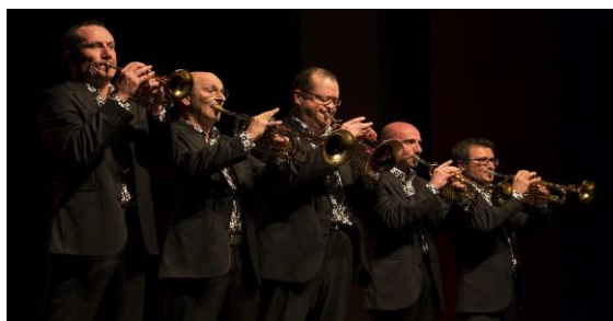
Slika 11 Trompettes de Lyon na Velikogoričkom Brass Festivalu 2014. godine

Na to da je Festival napredovao može se zaključiti iz riječi Tomislava Špoljara: "Prošlogodišnji gost James C. Lebens konstatirao je da je gostovao na mnogim festivalima, no kako mu je ovaj najdraži jer ima dušu te da mu u budućnosti neće biti važno za koliko je novaca svirao ili s kim je svirao, nego će se sjećati uspomena, razgovora s publikom i činjenice da se tjedan dana osjećao kao dio obitelji." (Špoljar, VGBRASS, 2022.) Festival i dalje sluša prijedloge publike pa se tako i po prvi puta uvode Jazz after-partiji gdje su posjetitelji festivala imali priliku ostvariti interakciju sa gostima festivala, a ujedno i uživati u glazbi vrhunskih hrvatskih jazz umjetnika kao što su Branko Sterpin, Josip Joachim Grah i Davor Križić – trube i Luka Žužić – trombon. Kako je Festival te godine posvećen Philip Jonesu, program pune mnogi komorni sastavi limenih puhača: Ad Gloriam Brass i Busina Brass kvintet iz Hrvatske, Tempera ansambl iz Izraela i Trompettes de Lyon osnovan od pet školovanih glazbenika sa muzičke akademije u Lyonu.