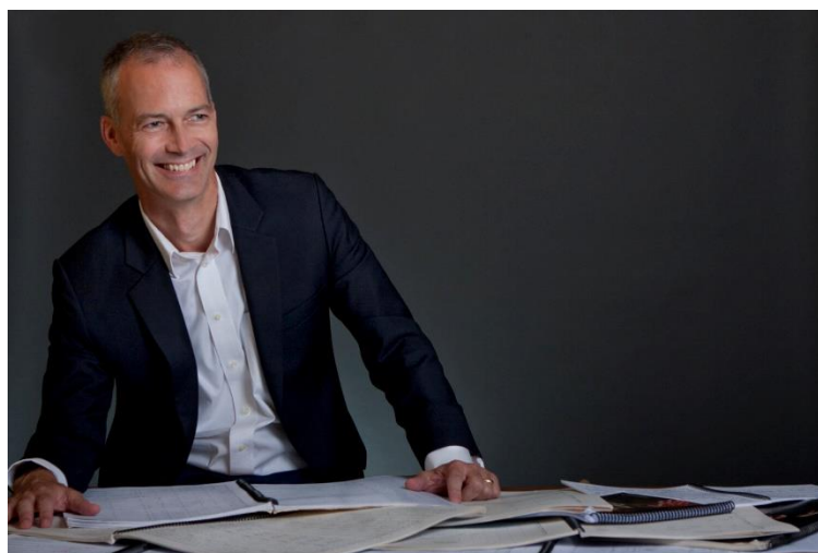
Slika 3 James Stephenson

James Stephenson (1969. – ) američki je skladatelj i poseban gost festivala 2009. godine. S obzirom na to da je svoju karijeru započeo kao trubač vrlo rano se upoznao s mogućnostima različitih instrumenata pa se i dan danas bavi aranžiranjem. Opus mu sadrži stopedeset i više djela. Diplomirao je na konzervatoriju u New Englandu 1990. godine.