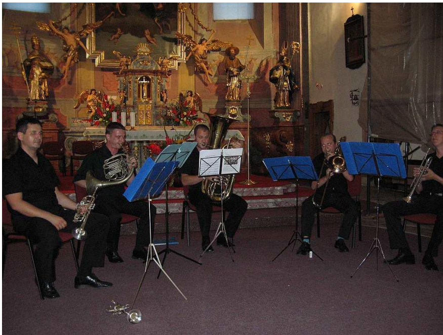
Slika 6 Simply Brass na Velikogoričkom Brass Festivalu

Na šestom izdanju Festivala Simply Brass izvodi ranije spomenutu skladbu Balkanika Erica Ewazena koja je posvećena njima i Festivalu. Kvintet je osnovan 2006. godine u Zagrebu, a nastupaju diljem Hrvatske i u inozemstvu. Jedan od značajnijih nastupa odrađuju u listopadu 2011. godine na Julliard School of Music. Kroz povijest samog Festivala nastupali su u više navrata te tako postaju i rezidencijalni ansambl.