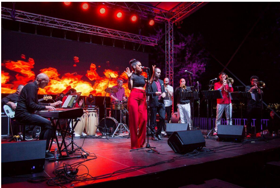
Slika 21 FILOSOFÍA SALSA na Velikogoričkom Brass Festivalu 2020. godine

Kako su 2020. godine mogućnosti Festivala u sastavljanju programa bile ograničene zbog epidemije SARS-CoV-2 virusa ponovno nastupaju već ranije spomenuti Los Caballerosi i rezidencijalni Simply Brass Kvintet. Na zadnjem danu festivala nastupa međunarodni autorski latino bend FILOSOFÍA SALSA u kojem djeluje jedanaest glazbenika i tonski majstor, a članovi su istaknuti glazbenici iz Hrvatske, Slovenije i Kube.