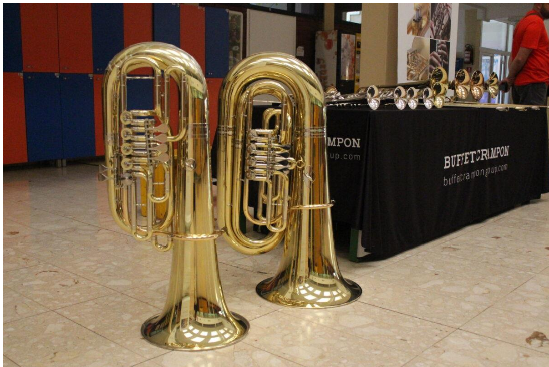
Slika 25 Izložba tvrtke Buffet Crampon na Velikogoričkom Brass Festivalu 2022. godine

modela instrumenata, izložbe olakšavaju sviračima njihovo isprobavanje i nude veći izbor u odabiru. Prije se zbog odabira instrumenta moralo ići na dalja putovanja što je bilo najbliže u trgovini glazbenih instrumenata Musik Bertram Freiburg u Njemačkoj. Nikada se neće uspjeti dostići razina npr. Američkih trubačkih konferencija na kojima se mogu naći svi modeli određenih proizvođača i iskusiti sloboda kombiniranja svih usnika i instrumenata, no dovođenje bar malog broja proizvođača pruža posebnost doživljaja festivala.” (Špoljar, Audio zapis, Razgovor s Tomislavom Špoljarom, 2022.) Također Festival uvijek pokušava sklopiti dogovor oko festivalskih cijena (koje često budu znatno niže nego inače), ali sam cilj izložbi je širenje vidika po pitanju proizvodnje i upoznavanja manje poznatih izlagača. Spoznajom toga dolazi se do odluke odlaska na festival kako bi se na licu mjesta isprobao instrument i otvorila mogućnost kupovine.