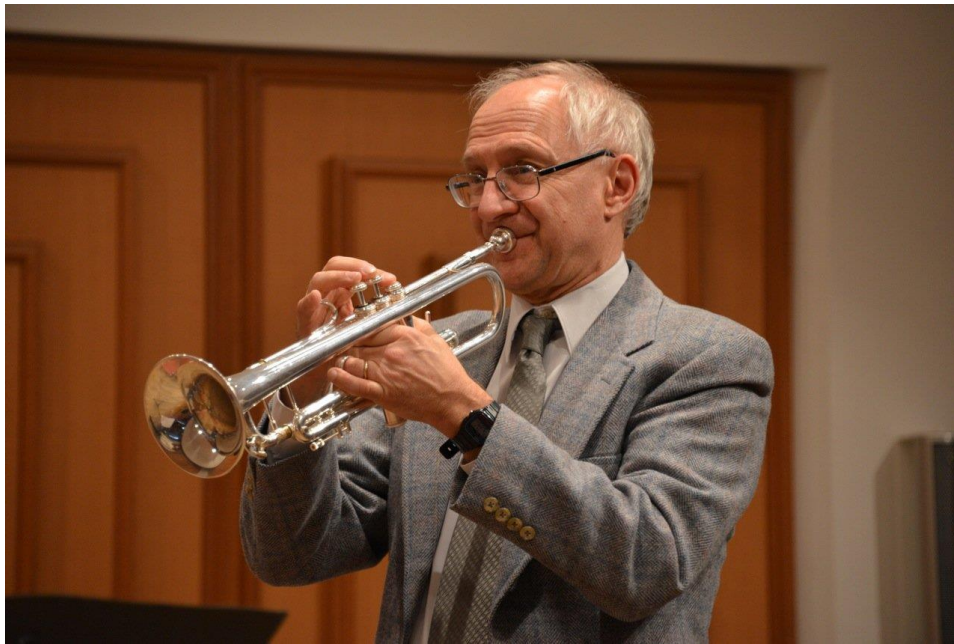
Slika 4 Anthony Plog

Kako se ideja pozivanja skladatelja pokazala veoma uspješnim i ove godine festival ugošćuje renomiranog Anthony Ploga (1947.) čija je skladba 2010. godine premijerno izvedena u Europi u sklopu programa. Skladbu su izveli Pasi Pirinen (truba) i Tamara Jurkić-Sviben (klavir). Anthony Plog je studij glazbe završio kod svog oca, a potom se školovao kod znamenitih trubača kao što su James Stamp i Thomas Stevens. Kroz svoju karijeru svirao je u mnogim orkestrima, a kao solist nastupao diljem cijelog svijeta. Trubačku karijeru završava odlaskom u mirovinu 2010. godine i potpuno se posvećuje skladanju.