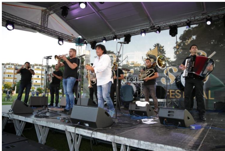
Slika 13 Orkestar Bobana Markovića na Velikogoričkom Brass Festivalu 2016. godine

Na jubilarnom desetom Festivalu po prvi puta je na programu uvršten i Gypsy Brass band koji je bio pozvan u svrhu proširivanju vidika publike o mogućnostima sviranja limenih puhačkih instrumenata. Na otvorenju nastupa Orkestar Bobana Markovića , trubača iz Srbije, a na programu Festivala se nalaze Les Trompettes De Lyon koji su nastupili već u par navrata. Također, opet su održani Jazz after-partiji koji su se pokazali kao dobra ideja 2014. godine.