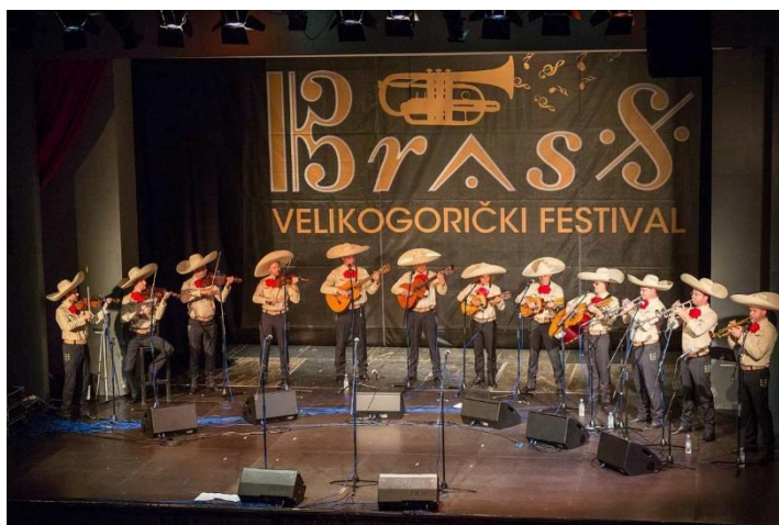
Slika 15 Mariachi Los Caballeros na Velikogoričkom Brass festivalu 2017. godine

Također i ove godine Festival pokušava proširiti vidike publike o limenim puhačkim instrumentima pa tako dovodi i vodećeg glasnogovornika mariachi glazbe u hrvatskoj, sastav Mariachi Los Caballeros . Od svog prvog koncerta 1998. godine u Kino klubu Zagreb postali su jedan od najuglednijih ambasadora mariachi glazbe izvan španjolskog govornog područja.