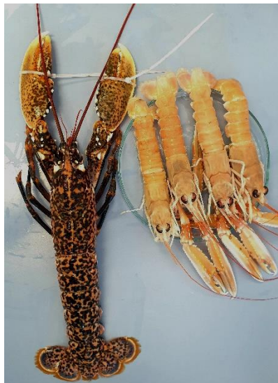
Slika 2. Jedinke hlapa i škampa

Jedinke škampa ( Nephrops norvegicus ) i hlapa ( Homarus gammarus ) nabavljene su na tržnici Dolac u Zagrebu. Neposredno nakon kupnje prebačene su u Laboratorij za opću mikrobiologiju i mikrobiologiju namirnica, Prehrambeno-biotehnološkog fakulteta Sveučilišta u Zagrebu. Nakon ispiranja s destiliranom vodom kako bi se uklonile fizičke nečistoće, u aseptičnim uvjetima uzeti su uzorci probavnog sustava koji su kasnije korišteni za analizu mikrobne populacije.