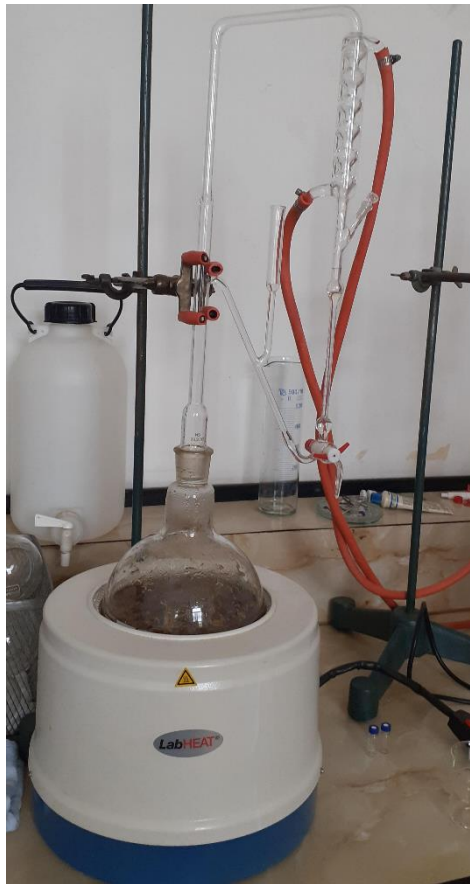
Slika 4. Aparatura za određivanje i izolacija eteričnog ulja iz cvjetova sredozemnog smilja s otoka Paga i Visa (Zavod za farmakognoziju Farmaceutsko-biokemijskog fakulteta)

biljnog materijala podvrgnuto tijekom 90 minuta pari generiranoj parogeneratorom, pri brzini pare od 70 kg/min.