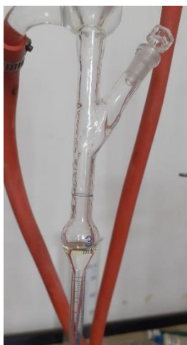
Slika 7. Eterično ulje sredozemnog smilja izolirano u aparaturi prema Europskoj farmakopeji

Određeno je da osušeni cvjetovi sredozemnog smilja s otoka Paga sadrže 4 mL/kg eteričnog ulja, a uzorak s otoka Visa 2,8 mL/kg (slika 7). Eterično ulje iz biljnog uzorka s otoka Cresa izolirano je parnom destilacijom s prinosom od 2,5 mL/kg (slika 8).