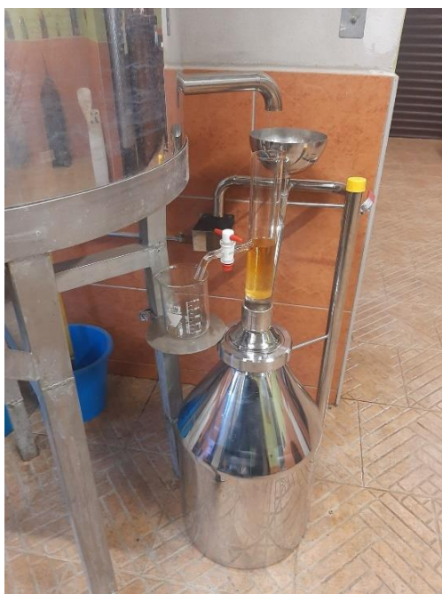
Slika 8. Eterično ulje sredozemnog smilja izolirano parnom destilacijom