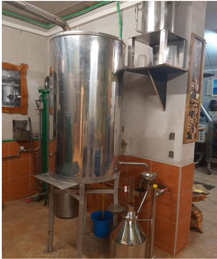
Slika 5. Aparatura za parnu destilaciju za izolaciju eteričnog ulja iz cvjetova sredozemnog smilja s otoka Cresa (OPG Kučić Guerino)