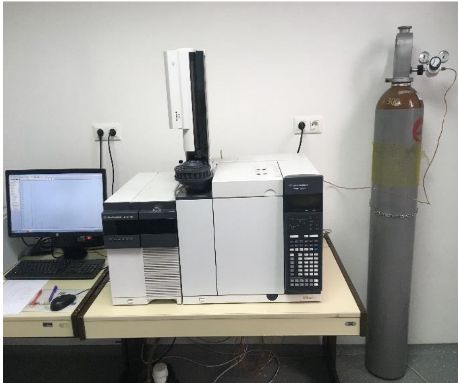
Slika 6. Spregnuti sustav plinske kromatografije sa spektrometrijom masa u kojem je napravljena analiza eteričnog ulja (Zavod za farmakognoziju Farmaceutsko-biokemijskog fakulteta)