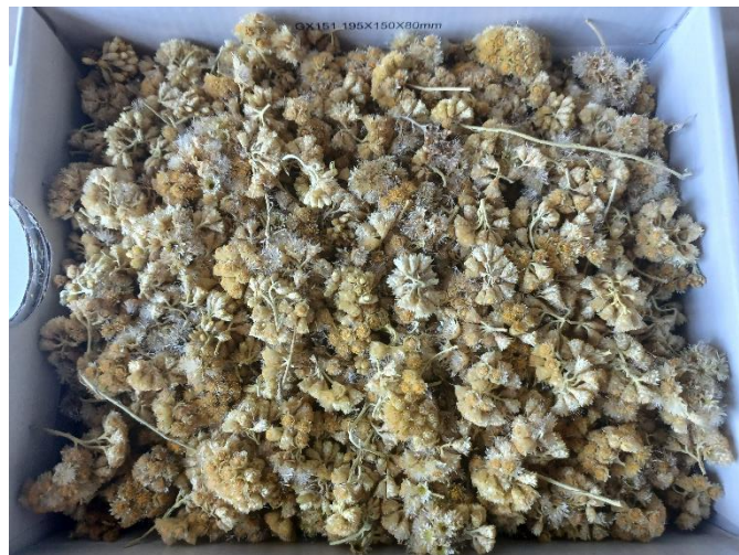
Slika 3. Osušeni cvjetovi sredozemnog smilja prikupljeni na otoku Pagu

Cvatući vršni dijelovi sredozemnog smilja - Helichrysum italicum (Roth) G. Don prikupljeni su na tri hrvatska otoka: Visu, Pagu i Cresu. Biljni materijal sakupljen je u blizini grada Komiže 2. lipnja 2023., zatim u mjestu Metajna na otoku Pagu 30. lipnja 2023. te u mjestu Martinšćica na otoku Cresu 26. lipnja 2023. Prikupljeni biljni material osušen je na sobnoj temperaturi u zaštiti od svjetlosti (slika 3).