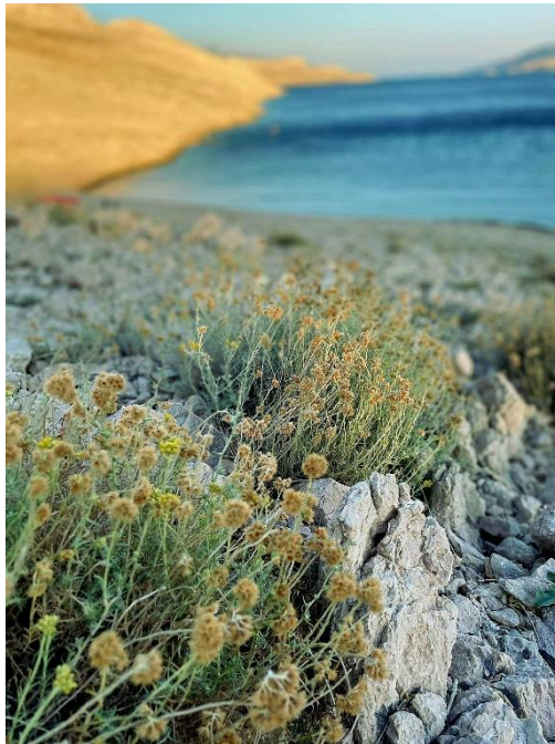
Slika 1. Smilje na otoku Pagu (fotografija Marina Đeldum Kustić, 8. rujna 2023.)

Sredozemno smilje - Helichrysum italicum (Roth) G. Don višegodišnji je polugrm visine do 70 cm koji raste duž mediteranske obale. Biljka je karakteristična po svojim vrlo aromatičnim zlatnožutim cvjetovima (slika 1), a cvate u razdoblju od svibnja/lipnja do kolovoza/rujna (1).