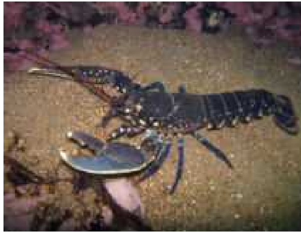
Slika 3. Hlap

Hlap ( Homarus gammarus ) je morski deseteronožni rak, poznat i pod nazivima lap, karlo, rarog, njakar, humer i ralog. Rije hlap zna i „težak momak koji vuče noge“ i on zaista vuče štípaljke po dnu proizvode i pritom karakterističan zvuk. Tijelo je u osnovi žuto i posuto je manjim modro-crnim mrljama među kojima se mogu naći i crveno-smeđe i ljubičaste mrlje. Ima svojstvena velika i jaka kliješta koja mogu biti različitih oblika. Glavopršnjak i zadak su glatki i nemaju izrasline, a oklop je jak. Kliješta su mu izrazito velika i služe mu za rezanje i drobljenje plijena. Ima i manja kliješta koja mu služe za hranjenje i obranu (Slika 3). Može narasti do jednog metra i biti težine do 9kg, a prosječni su primjerci dugi oko 40 cm i teški oko 1 kilogram. Najveći ulovljeni ikad bio je dug 1.26 m i težak 9.3 kg i kao takav je ušao i u Guinnessovu knjigu rekorda.