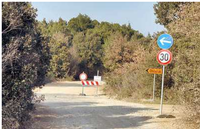
Sl. 9. Gradnja prometnica jedan je od načina ugrožavanja staništa vodozemaca

Promjena staništa je takav utjecaj na stanište koji utječe na funkciju ekosistema, čak i ako to nije potpuno ili trajno. Primjer je ispaša stoke. Stoka može izgaziti vodenu vegetaciju i izazvati ubrzanu eroziju obale bare čime stanište postaje nepovoljno za vodozemce. Rješenje za ovaj problem bilo bi ograničavanje dijela bare kako bi se stoci onemogućio pristup, što za posljedicu ima nesmetan rast vegetacije na ograničenom dijelu.