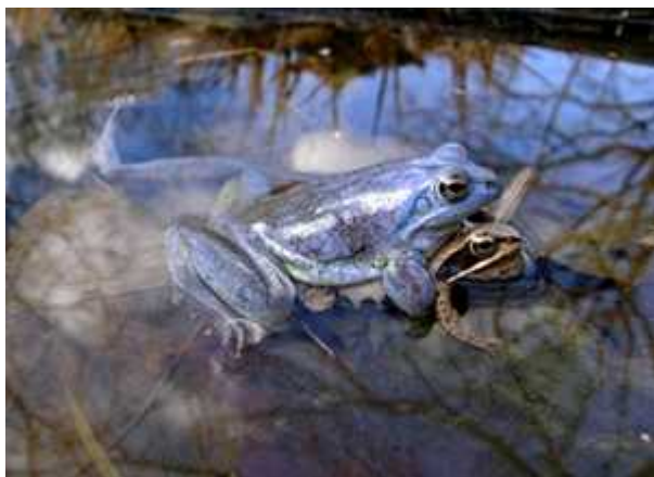
Sl. 4. Parenje ženke i plavo obojenog mužjaka močvarne smeđe žabe ( Rana arvalis )

Zanimljivo je da postoji mogućnost da katkad naiđemo i na žabe vrlo neobičnog i neuobičajenih boja. Tako postoji i plava boja kod nekih žaba, i to pripadnika muškog spola. Plava obojenost sasvim je normalna pojava u životu jednog mladog mužjaka močvarne smeđe žabe (lat. Rana arvalis ). Takav mužjak svojom bojom zapravo želi svim prisutnim ženkama jasno i glasno reći da je spreman za parenje. (Sl. 4.) Cijela priroda ustvari započinje krajem zime, u ožujku ili travnju. Tada dnevne temperature dosegnu 15-17°C te se mužjaci i ženke žaba počinju okupljati radi parenja. Radi privlačenja ženki mužjaci postupno mijenjaju boju, iz normalne smeđe-crvenkaste s tamnim pjegama, u tamno-ljubičastu, a na kraju konačno i u prepoznatljivu nebeskoplavu. Što je savršenija plava boja mužjaka to će više ženki privući i time si osigurati više potomstva. Mužjaci se uz boju, ujedno služe i glasanjem karakterističnim samo za ovu vrstu, čime se partneri prepoznaju.