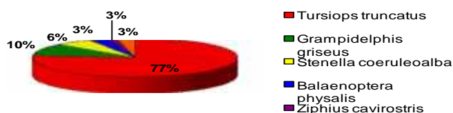
Grafikon 1. Vrste na ene u Jadranskom moru 2001./ 2002. godine

Osim procjenjivanja veličine i rasprostranjenosti populacije dobrog dupina u zadnjih dvadesetak godina istraživačkim brodicama, istraživanje se provelo i u dva navrata iz 4 mala aviona, kada je bio bilježen njihov položaj i broj. Veličina populacije dobrog dupina, kao jedinog stalnog stanovnika Jadrana, procijenjena je na 250 jedinki rasprostranjenih po cijelom Jadraniu. Prema istraživanjima u posljednjih desetak godina, ova se populacija s obzirom na prisutni broj životinja smatra stalnom (Gomer i sur. 1998).