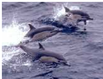
Slika 10. Manja skupina običnih dupina