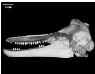
Slika 7. Kostur lubanje dobrog dupina

Dobri dupin ( Tursiops truncatus (Montague 1894.)) živi u europskim morima i to uz rije na uš a gdje se hrani ribama i brzo pliva, te pari od prolje a do ljeta i nosi mlado 10-12 mjeseci da bi se kotilo u lipnju ili srpnju. Mlado siše mlijeko 16 mjeseci, a samostalno je tek nakon godine i šest mjeseci i spolno zrelo sa 6 godina. Gornja im je eljust kra a od donje, a u svakoj imaju 18-27 pari zuba (sl. 7). Boja hidrodinami ki oblikovanog tijela može varirati od tamno plave do sivo-sme e na le ima, preko svijetlo sive na bokovima i bijele na truhu, do ruži aste nijanse koju može poprimiti pri visokoj temperaturi tokom ljeta (sl. 8). Odrasle jedinke dosežu dužinu od 2 do 4 metra (u Jadraniu najviše oko 3 metra) i težinu 100 do 500 kilograma. Njihova populacija u hrvatskom dijelu Jadranskog mora procjenjuje se na 220-250 jedinki (Gomer i i sur. 2002, Gomer i i sur. 2004). Ova vrsta živi u gotovo svim morima svijeta, no ne postoji potpuna procjena broja jedinki u svijetu. Za populacije u Sredozemnom moru smatra se da broje manje od 10 000 jedinki, a sve to zbog prelova ribe i uništavanja staništa ( uras 2006, Galov 2007).