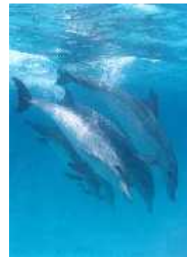
Slika 6. Usklađenost dupina u skokovima

U Shark bay-u u zapadnoj Australiji znanstvenici proučavaju nasrtljivost dobrih dupina gdje su se formirale određene skupine mužjaka koje funkcioniraju poput banda. Tamo se bitke najčešće vode zbog ženki; udružuju se i radi otimanja ženki odnosno sprečavanja istih da se pare s drugim mužjacima, a često se ponašaju makijavelistički. Ipak, za to je potrebna suradnja i održavanje dobrih odnosa unutar skupine ( serendip.brynmawr.edu ).