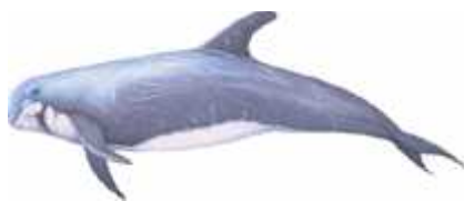
Slika 9. Glavati dupin ( Grampus griseus )

Glavati dupin ( Grampus griseus , engl. Risso's dolphin) kreće se u skupinama od 10-15 životinja, koje se mogu spajati i s drugim jatima, no u Jadransko more zaluta često samo pojedinačna jedinka ili manja skupina. Inače se često kreće uz neke druge vrste kitova, a uoči je čak i križanje s dobrim dupinima. Lako ga je prepoznati po velikim (dug je do 3,8 metara), zatim po neobičnoj tupastoj glavi bez kljuna, naboru na sredini melona, visokoj leđnoj i srpolikim prsnim perajama, te jednoličnoj sivoj boji s bijelim ožiljcima, koji se s godinama nakupljaju, pa su tako jedinke starije od 30 godina sasvim bijele (Gomer i sur. 2006).