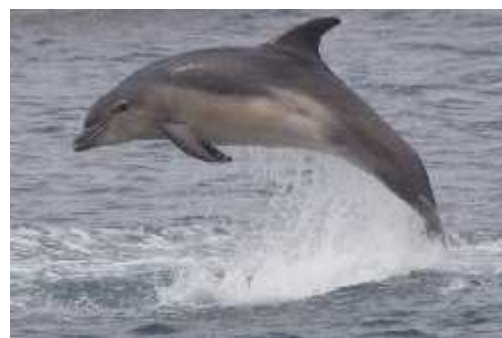
Slika 8. Dobri dupin