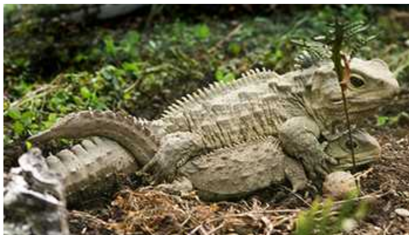
Slika 4. Parenje – rijedak događaj

Izvišteno se da zaključiti da se vrlo malo energije ulaže u razmnožavanje i podizanje mladih. Zato se ona usmjerava na metabolizam, koji je spor, ali koji uzrokuje neobično dugi životni vijek jedinki. Spolna zrelost se dostiže tek sa 15 godina, a krajnja veličina sa 25 do 35 godina. Iako je taj podatak još uvijek misteriozan, tuatara u prosjeku žive 61-71 godinu, a pretpostavlja se da mogu živjeti i više od 100 godina (MacAvoy, 2007.).