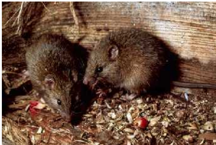
Slika 6. Kiore štakori ( http://www.teara.govt.nz/files/p16116doc.jpg )

Štakori se smatraju najozbiljnijom prijetnjom tuatarama jer se lako transportiraju već spomenutim plovilima, te su najčešće prve alohtone vrste koje neopaženo pristižu na nova staništa. Otoci sa štakorima imaju vrlo malo nokturalnih beskralješnjaka, vodozemaca i gmazova jer, u nedostatku hrane, oni opelješe njihove nastambe odnosno gnijezda, jedu i jaja i tek izlegle mladunce, ali i odrasle jedinke. Odrasli premosnici nemaju prirodnog neprijatelja i štakori ih rijetko napadaju, ali rade štetu za njihov reproduktivni uspjeh, što je za životinju sa usporenim životnim ciklusom i slabom stopom razmnožavanja, prilično pogubno.