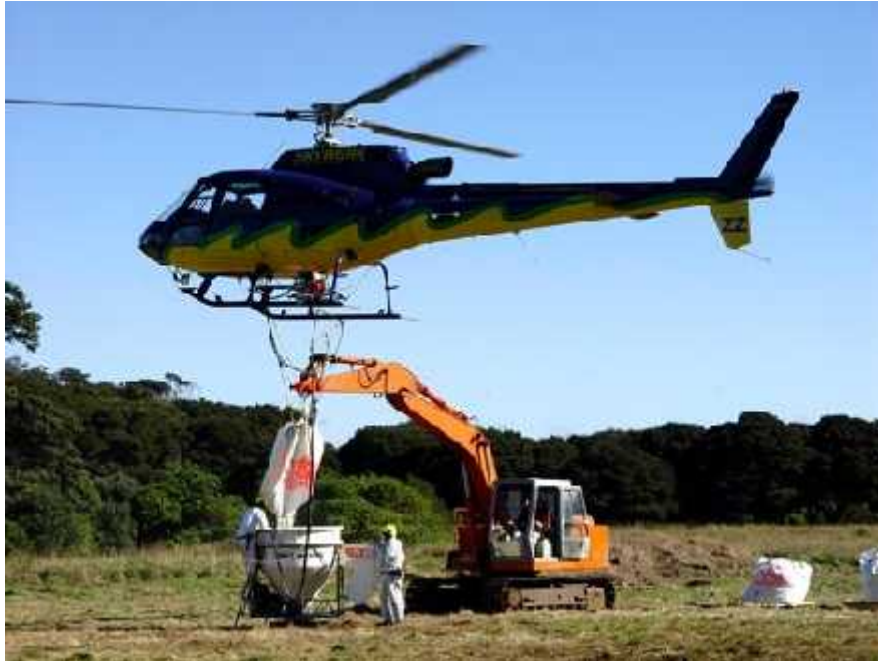
Slika 9. Desant na otok Hauturu, zima, 2004. ( http://www.teara.govt.nz/files/p14990pc.jpg )

DOC je drugi dio akcije proveo 2004. godine, i to je bio drugi najveći program istrebljenja štakora na Novom Zelandu. U dva zračna izbacivanja na otok u razmaku od 6 tjedana, tri helikoptera su 'posijala' čak 55 tona otrova i zamki za štakore na cijelu površinu velikog otoka u pokušaju da unište polinezijske štakore (Slika 9).