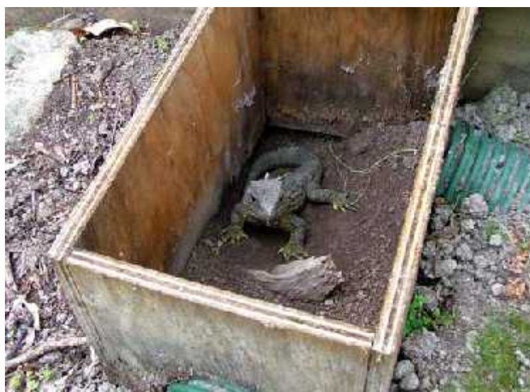
Slika 8. Sklonište sa uklonjenim poklopcem, te cijevima za izlazak/ulazak ( http://www.teara.govt.nz/files/p14992pc.jpg )

Do 1991. godine niti jedna jedinka nije bila uočena u posljednjih 14 godina, ali su populacije kiore štakora zato cvale. Strahovalo se da su sve tuatari izumrle, sve do detaljnih nadzora krajem godine i početkom 1992., kad se pronašlo 8 preživjelih odraslih jedinki. Oni su uhvaćeni i premješteni u obore u kojima su napravljena improvizirana skloništa (Slika 8) koja su ih štvala od najezde štakora. Naposljetku su se preostali gmazovi razmnožili i njihova jaja su inkubirana u zatočeništvu, a mladi su odgajani u okolišima slobodnim od kiore (Keall, 2009).