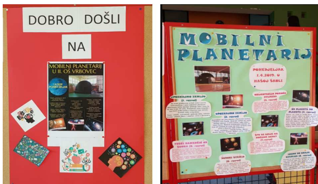
Slika 2.2: Obavijest učenicima o terenskoj nastavi