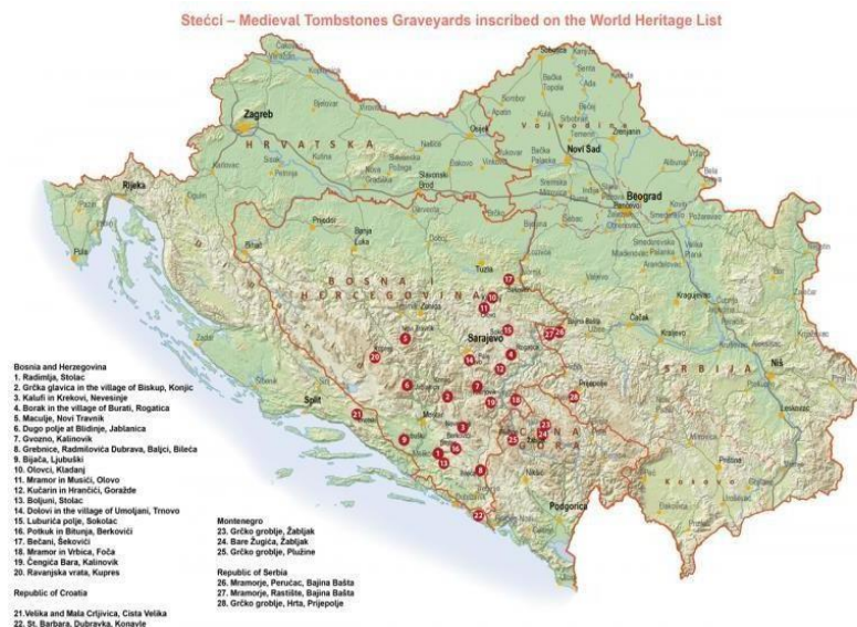
Sl. 12. Prikazuje teritorijalni raspored nekropola u BiH