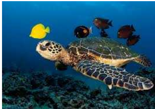
Slika 6. Glavata želva

( http://www.kornjace.com/modules/cjaycontent/index.php?id=25 ) .