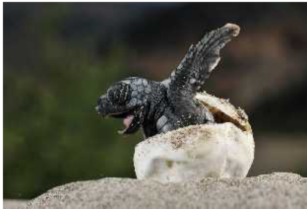
Slika 3. Izlaz kornjake iz jajeta

Razmnožavanje je gotovo identično kod svih vrsta morskih kornjaka. Ženke kada su spolno zrele migriraju iz staništa ishrane u stanište razmnožavanja, što posebno kod nekih vrsta znači i put i od nekoliko tisuća kilometara. U obalnom moru, blizu plaže pare se sa mužjacima te nedugo nakon toga izlaze na pješačane plaže kako bi se gnijezdile. Kopaju rupe u pijesku pomoću prednjih peraja i zatim u njih polažu i do 100 jaja veličine loptice za golf. Ponovno zakopavaju rupu pijeskom i vraćaju se u more ostavljajući svoje potomstvo zauvijek ( http://www.plavi-svijet.org/hr/kornjace/ ).