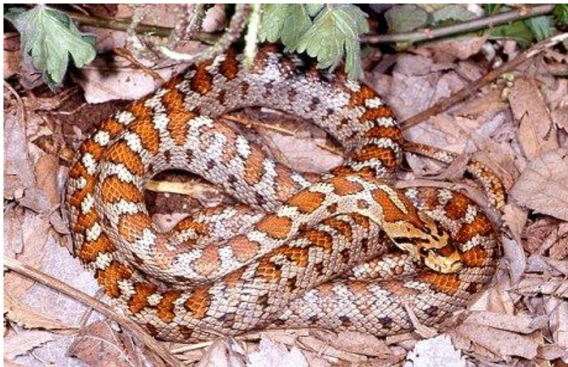
Slika 6. Crvenkrpica ( Zamenis situla )

Crvenkrpica (sl. 6.) je zmija vitkog tijela i uske glave, prosječna duljina tijela je od 60–100 cm. Temeljna boja je siva ili crvenkastosiva (može biti i žućkastosiva te zelenkastosiva) s velikim crvenosmeđim pjegama (pjegavi morfološki tip) ili prugama (prugasti morfološki tip) koje imaju crni obrub. Naizmjenično s leđnim mrljama s obje strane tijela, niže se niz manjih crnih, većinom poprečnih, mrlja. Na glavi s gornje strane gotovo uvijek postoje crne ili smeđe poprečne trake, a na zatiljku je tamna zatiljna mrlja iza koje počinje niz tamnocrvenih ili smeđih mrlja. Kod prugastih se oblika leđne mrlje niz hrbat postupno stapaju u dvije pruge koje se protežu do vrha repa. Oba morfološka tipa možemo naći u mnogim populacijama u različitim omjerima, iako je prugasta forma obično dosta rjeđa. Mlade jedinke imaju obojenost kao i odrasle jedinke (Jelić i sur. 2012b).