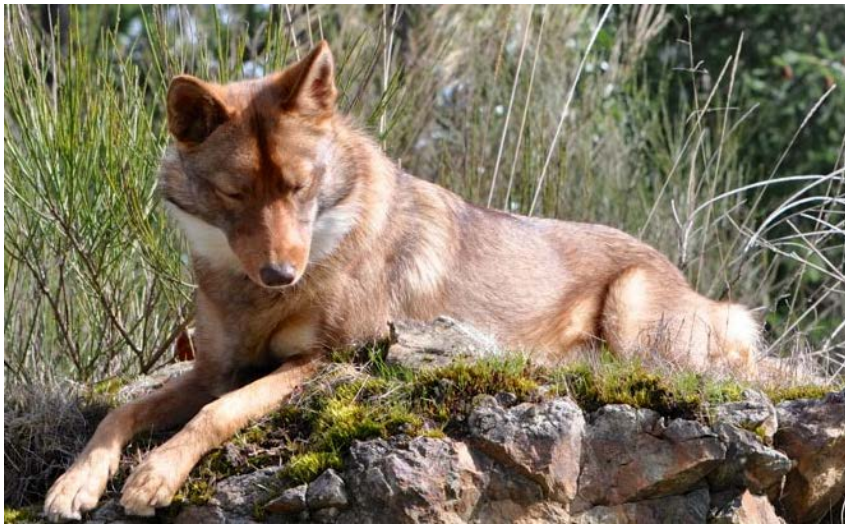
Slika 5. Hibrid psa i kojota ( http://www.coydog.ca )

djelovima SAD-a zakonski je dozvoljeno imati ih kao kućne ljubimce, no s njima se teško može postupati, što je očekivano za životinju koja sadrži DNA potpuno divlje vrste.