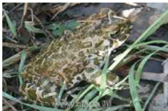
Sl. 15. Veoma ugrožen vodozemac Podravine: zelena gubavica ( Bufo viridis L. )