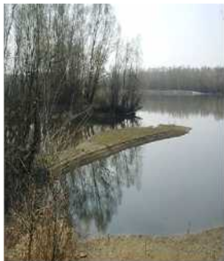
Sl.6. Drava kao riječni tok i stanište mnogim biljnim i životinjskim vrstama

Drava je u Hrvatskoj ujedno i jedan od posljednjih prirodnih, slobodnih rijeka u Europi. Dom je i mnogih vrsta ptica te prostor također bogat biljnim vrstama. Mnoge vrste biljaka, riba, kukaca, sisavaca i vodozemaca protežu se uzduž riječnog koridora Mure i Drave.