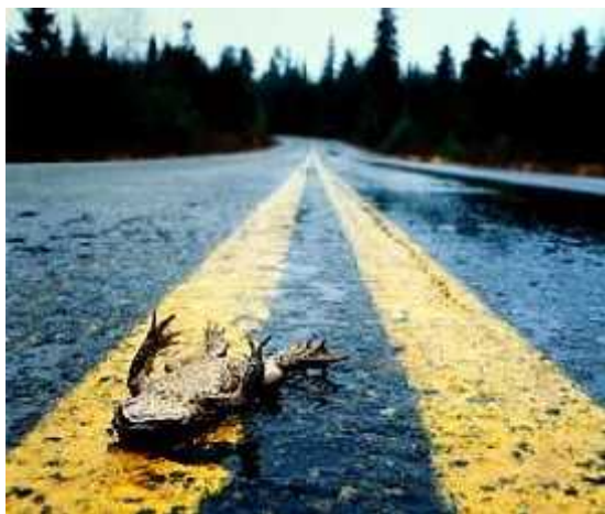
Sl. 5. Stradavanje vodozemaca na prometnicama; pregažena žaba