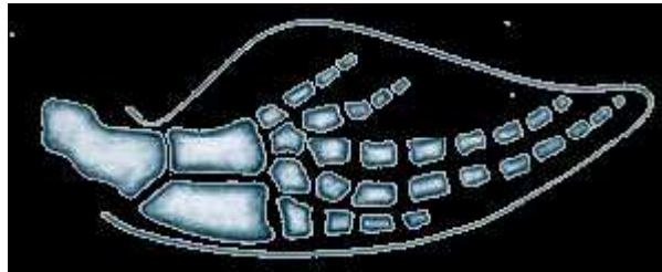
Slika 3. Kosti prednjeg uda kita ( http://cetacea147.tripod.com/anatomy.html )

Prednji udovi kitova su preoblikovani u pokretne peraje. Nadlakti, palčana i lakatna kost su skraćene dok su prsti izduženi zbog dodatnih falangi (Slika 3).