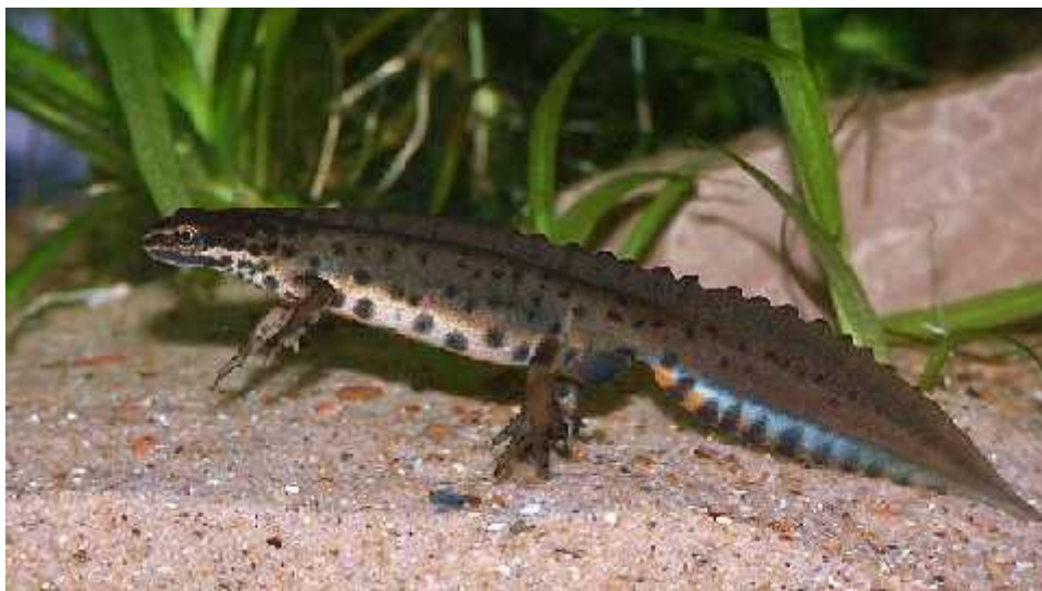
Slika 6.) Lissotriton vulgaris – mali vodenjak

Ova vrsta naseljava ve i dio Europe i zapadne Azije.