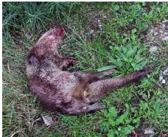
Slika 10. Vidra stradala na prometnici

Vidru ugrožava redovito iš enje “zelenih koridora” (kanala, potoka, obalnih zona) koji imaju važnu ulogu u migracijama vidre. Stradavanja u prometu (Sl.10.) su esta zbog nedostatka tunela i prolaza za životinje. Vidru najviše ugrožava one iš enje voda, time nestaju organizmi kojima se one hrane, a javlja se problem akumuliranja toksi nih tvari kroz hranidbeni lanac. Nedostatak financijske potpore ribnja arstvu uzrokuje napuštanje ribnjaka koji su bili pogodno stanište vidrama. Vidru ugožavanju i problemi na prirodnim staništima kao što su ljetne suše i nedostatak hrane (Lanszki i Kova i , 2007.).