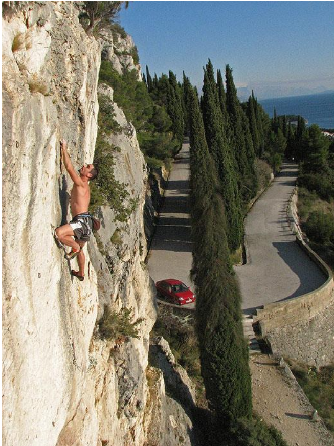
Sl. 2. Penjalište „Šantine stine“ u park-šumi Marjan

predvečerje (stijena je u hladu od 18h). U povijesnom razvoju penjanja u Splitu važno je spomenuti i Sustipan i sezonu 2005. kada se na penjalištu po prvi puta počelo penjati isključivo u penjačicama (URL 12).