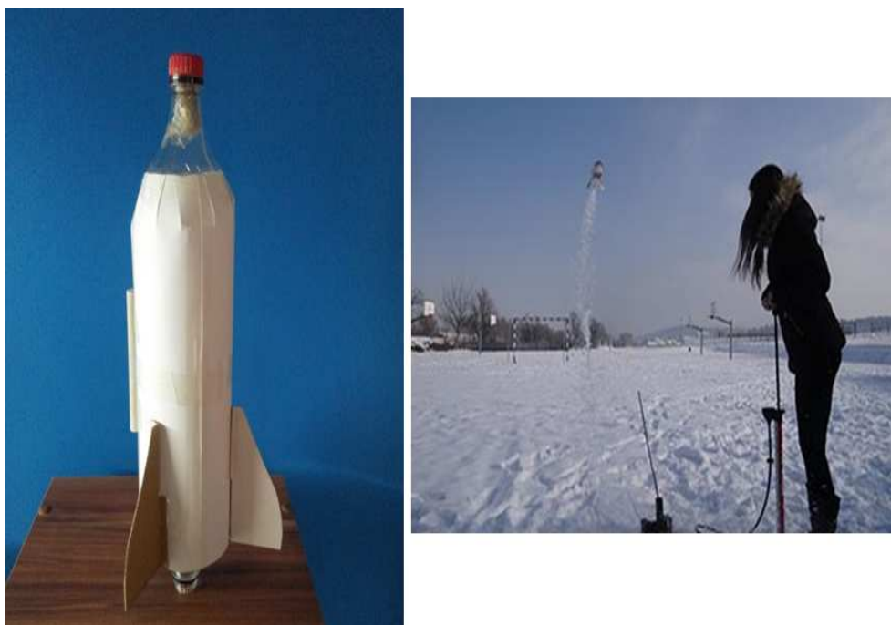
Slika 2.14: Raketa na vodu

za izradu. Za izradu rakete potrebne su dvije plastične boce, karton, ljepljiva traka, kamen i vodilica. Učenici mogu koristiti i drvene bojice te flomastere kako bi ukasili raketu.