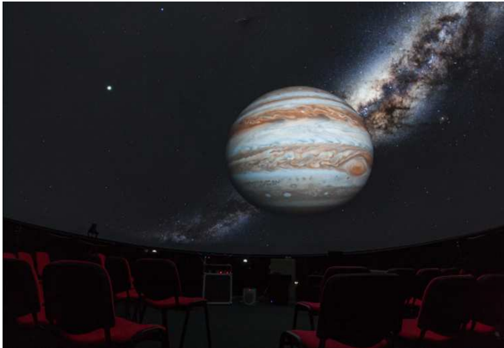
Slika 2.8: Jupiter

Miskonceptije koje učenici vežu uz planete je da su planeti Sunčevog sustava jedini planeti koji postoje u svemiru i da je razlika između planeta i zvijezda u tome što su planeti veći od zvijezda. Pošto samim promatranjem neba učenici ne uočavaju razliku između planeta i zvijezda potrebno je iskoristiti druge mogućnosti planetarija te se tu pomoću filmova lako mogu prikazati razlike u veličini između planeta i zvijezda. Filmovi u planetariju mogu biti dobar izvor znanja, odnosno uočavanja pojava koje ne vidimo na nebu. Oni u planetariju nikad ne smiju biti primaran izvor znanja. U planetariju je moguće promatrati i putanje gibanja planeta s točno označenim trajektorijama, no zbog kupole ta postavka nije najbolje vidljiva.