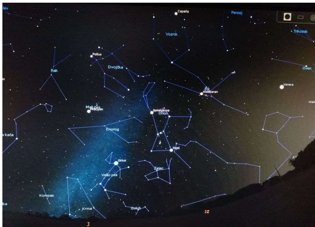
Slika 2.7: Zvijezđa

Osim dnevnog, u planetariju je moguće promatrati noćno nebo. Na noćnom nebu vidljive su zvijezde, planeti i galaksije. Zvijezde se mogu povezati u zviježđa. Uz svako zviježđe prikazano je ime zviježđa i slika zviježđa (Slika 2.7). Zvijezđa su posebno zanimljiva učenicima prvog i drugog razreda osnovne škole jer se mogu povezati s nekom legendom i zanimljivom pričom iz koje učenici mogu izvući pouku. Također učenici mogu uočiti da se zvijezde unutar zviježđa ne pomiču, odnosno da zviježđa pomicanjem u vremenu zadržavaju svoj oblik, no također mogu uočiti da tijekom godine vidimo različita zviježđa pa se tako mogu promatrati zviježđa zimskog i ljetnog neba. Zbog mogućnosti promijene geografske širine mogu se promatrati južna i sjeverna zviježđa. Svako zviježđe moguće je promatrati posebno.