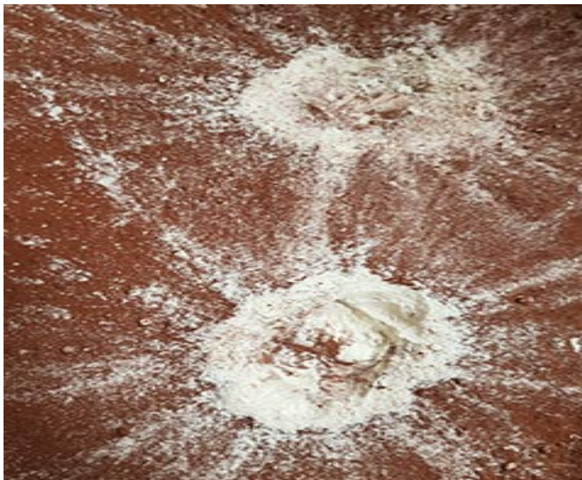
Slika 2.13: Pokus površina Mjeseca