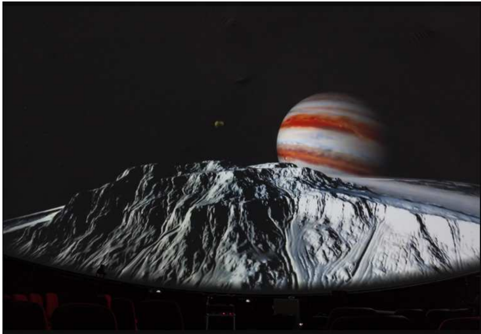
Slika 2.11: Pogled s Europe