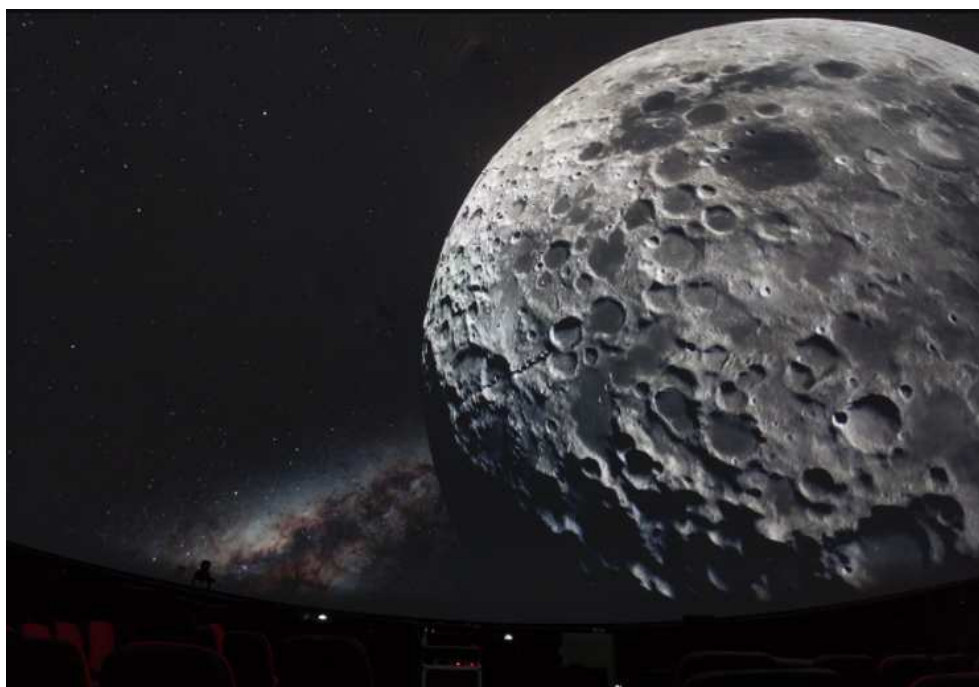
Slika 2.12: Površina Mjeseca

Eruptivna aktivnost vulkana koja na Zemlji mjestimice pridonosi oblikovanju površine na Mjesecu je imala značajnu ulogu jedino u davnoj geološkoj prošlosti toga tijela. Uočavajući brojne kratere na lunarnom tlu, astronomi su nekoliko stoljeća držali kako je Mjesec zasigurno objekt prepun vulkana, pa je on kao takav dugo vremena prikazivan u popularnoj literaturi. Zamisao da bi te jame mogle biti posljedica padova kamenja s neba, sve do razmjerno nedavno nije bila dobro primana od strane autoriteta. Danas, međutim, znamo da su praktično sve lunarne planine ishod silovitih poremećaja površine izazvanih sudarima s malim tijelima Sunčeva sustava [4].