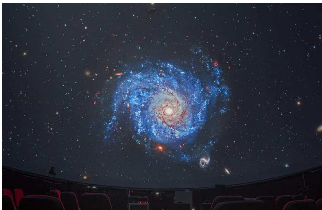
Slika 2.10: Galaksija