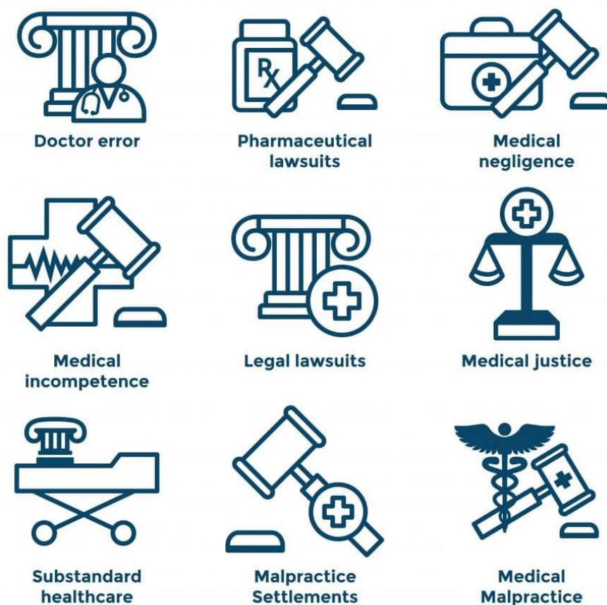
Slika 1. Od čega je sve pacijent zaštićen kaznenim pravom 29

„Slovensko kazнено zakonodavstvo sadrži istu inkriminaciju nesavjesnog liječenja i obavljanja zdravstvene djelatnosti, s time da se kažnjava medicinski djelatnik samo za nehajno nesavjesno liječenje, dok će onaj koji prouzroči smrt pacijenta namjernim postupanjem u suprotnosti s pravilima medicinske znanosti i struke biti odgovoran za opće djelo ubojstva.“ 28 U idućem poglavlju će biti nešto više riječi o pravnoj regulaciji kaznene odgovornosti zdravstvenih radnika u Republici Hrvatskoj.