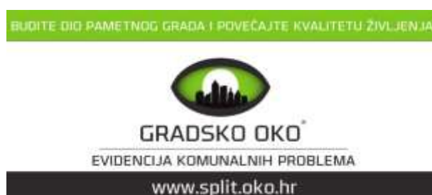
Slika 5. Gradsko oko Split

Sustav Gradsko oko služi za kreiranje, zaprimanje, prosljeđivanje i pregled prijava uočenih problema u domeni komunalnog sustava jedinice lokalne samouprave. Kako bi se postavilo pitanje ili prijavio problem, potrebno je prijaviti se sa svojim korisničkim podacima. Informatički sustav Gradsko oko kreiran je za potrebe gradskog komunalnog odjela, a ujedno omogućava i dvosmjernu komunikaciju i pristup raznim sudionicima i građanima. Sustav omogućuje uključivanje širokog broja sudionika u jednostavno stvaranje evidencije komunalnih problema. 22