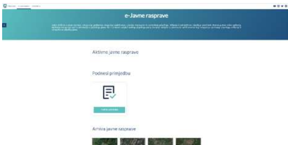
Slika 1. Službena web stranica e-Javne rasprave

E-Javne rasprave je usluga koja građanima omogućuje sudjelovanje u javnim raspravama te podnošenje prijedloga, mišljenja ili primjedbi na prijedloge prostranih planova putem online aplikacija. Aplikacija omogućuje uvid u informacije o prijedlogu plana, lociranje zahtjeva u prostoru te sadrži obrazac koji omogućuje upućivanje prijedloga, mišljenja ili primjedbe na prijedlog plana. Za sudjelovanje u e-Javnoj raspravi potrebno je registriranje preko NIAS sustava prijavom u aplikaciju e-Građani, te automatski povezivanje sa sustavom gradske uprave. Na web stranici Grada Zagreba dostupne su aktivne javne rasprave, obrazac za podnošenje primjedbe na javnu raspravu te arhiva javnih rasprava. Tijekom izrade ovog rada, aktivnih javnih rasprava nije bilo, a u arhivi je bilo vidljivo dvanaest javnih rasprava. Ključni ciljevi aplikacije e-Javne rasprave su smanjiti vrijeme zaprimanja mišljenja, prijedloga i primjedbi na prijedlog prostornog plana, smanjiti vrijeme i ubrzati proceduru obrade zaprimljenih mišljenja, prijedloga i primjedbi, osiguranje vjerodostojnosti podnositelja mišljenja, prijedloga i primjedbi, sigurno i povjerljivo jedinstveno mjesto komunikacije sa građanima i poslovnim subjektima, vjerodostojna verifikacija dokumenata te jednostavna i brza produkcija javnih rasprava. 10