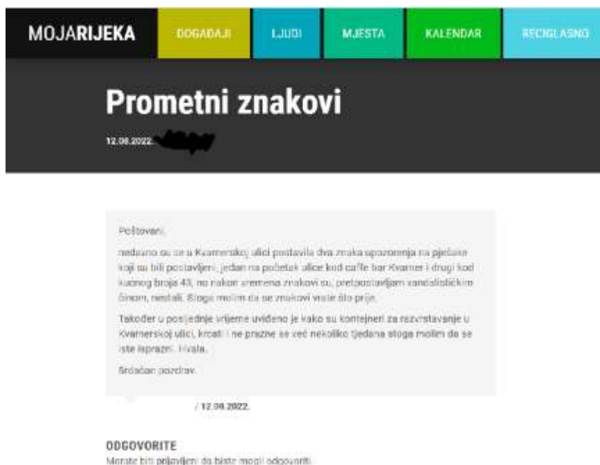
Slika 3. Primjer objave u rubrici Reci glasno

Rubrika Reci Glasno namijenjena je poboljšanju i razvoju zajedničkog životnog prostora. Svojim objavama, komentarima, upitima, pohvalama i pritužbama, riječju i fotografijama građani mogu doprinijeti kvaliteti života u Rijeci. Građani se moraju registrirati, odnosno prijaviti na web stranici Grada Rijeke kako bi nešto objavili ili pitali. Na pitanja odgovaraju osobe iz gradske uprave ili će se odgovor potražiti u širem gradskom sustavu – gradskim komunalnim društvima, javnim gradskim ustanovama i sl.. Rubrika Reci Glasno nije namijenjena komentiranju tuđeg pitanja ili mišljenja, već iznošenju vlastitog i to unutar teme. Nije dozvoljeno vrijeđati druge korisnike te rubrike, institucije ili osobe. Svako ne pridržavanje tih uputa rezultira uklaňanjem objave bez prethodnog upozorenja 17 .