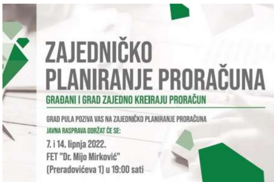
Slika 4. Plakat poziva na "Zajedničko planiranje proračuna"

Cilj projekta je da građani i gradska uprava zajednički planiraju projekte koji će se održati tijekom sljedeće 2023.godine. Projekt je kreiran na temelju iskustava u provedbi participativnog budžetiranja hrvatskih i europskih gradova. To je informacijska kampanja kojom se poziva građane da sudjeluju u već spomenutom projektu Zajedničko planiranje proračuna. Putem obrazaca građani će predlagati gradskoj upravi potrebe koje bi trebalo financirati sljedeće godine, a Grad procjenjuje dopuštenost provedbe, troškove i rokove. Nakon toga, u drugoj polovini rujna i početkom listopada, održat će se tribine po svim mjesnim odborima o potrebama koje će se financirati. Potrebe se zatim uvrštavaju u plan proračuna za iduću godinu. 20