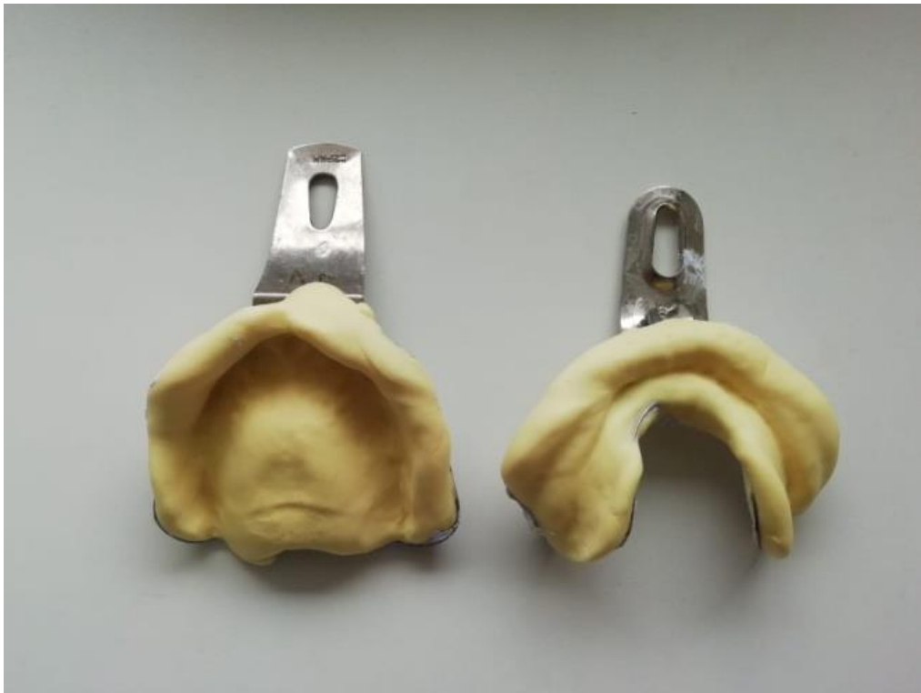
Slika 3. Prvi otisak

stanje. Glavni je sastojak alginata alginska kiselina koja se dobiva iz morskih biljaka. Alginat sadrži kalijeve, natrijeve i amonijeve soli alginske kiseline. Kada otopine tih soli dođu u dodir s kalcijevom soli, stvara se elastični gel. U prašku se nalazi topljiv alginat i dihidrat kalcijeva sulfata. Miješanjem praška s vodom nastaje kalcijev alginat. Svojstva zbog kojih se alginat primjenjuje za izvođenje prvog otiska mnogobrojna su. Precizno prikazuje detalje tkiva ležišta, registraciju nabora sluznice i aktivnosti okolnih mišića. Dovoljno je elastičan materijal da omogućuje lako vađenje iz usta preko potkopanih područja, a bez trajne deformacije. Zbog relativno niske viskoznosti omogućuje otisak bez dislokacije mekih i pomičnih tkiva, a detalji otisnute površine usta ne mijenjaju se u vlažnom mediju. Samo izlijevanje modela u gipsu lagan je postupak te je to materijal koji je relativno ekonomičan (1).