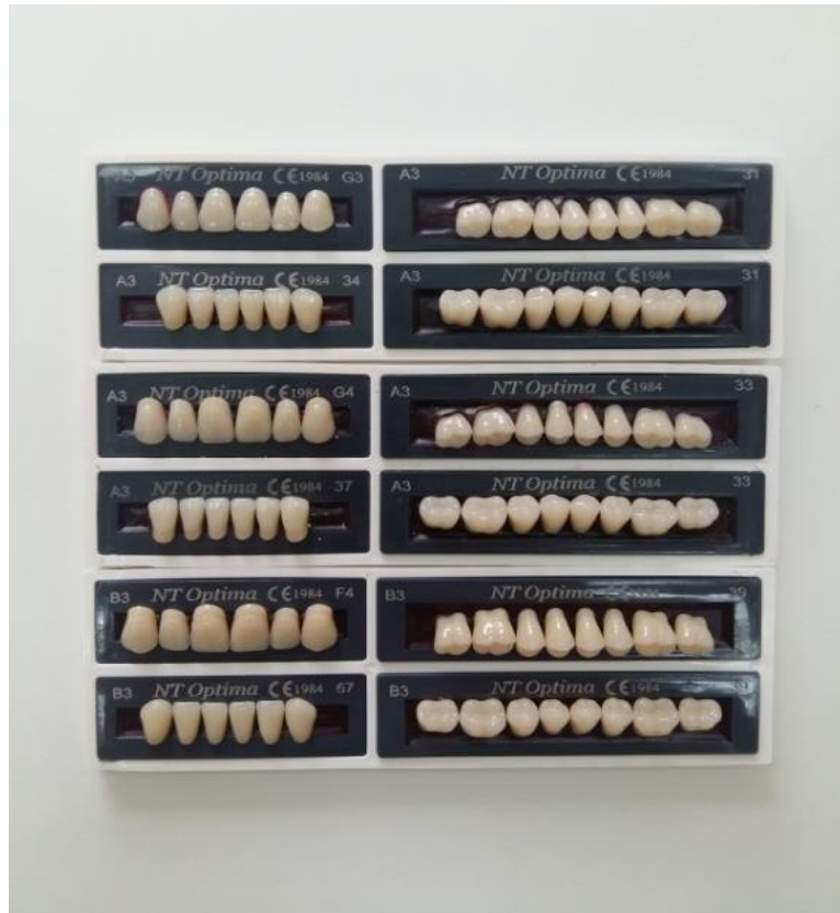
Slika 1. Različiti oblici, veličine i boje umjetnih zuba

Postavljanjem proteze u pacijentova usta neposredno nakon vađenja zuba sprječava se kolaps usnica i obraza. Stoga je estetska vrijednost imedijatne proteze velika. Važno je naglasiti i psihološku sigurnost koju ona pruža jer se izbjegava razdoblje bezubosti, što omogućuje nesmetanu poslovnu i društvenu aktivnost (7).