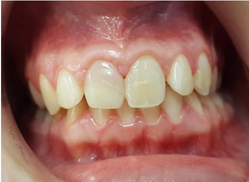
Slika 8. Ekstraoralna slika središnjih i lateralnih sjekutića nakon uspješno provedene terapije (preuzeto s dopuštenjem doc. dr. sc. Škrinjarića)