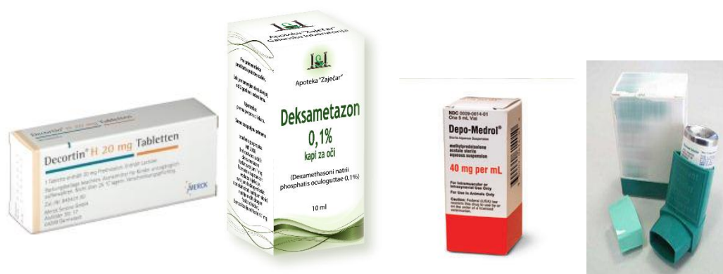
Slika 2. Kortikosteroidni lijekovi s različitim načinima primjene. Preuzeto: (12)

Prirodni kortikosteroidi i njihovi derivati brzo se i potpuno apsorbiraju nakon peroralne primjene; biološki aktivan dio se brzo i razgrađuje u jetri, a izlučuje se urinom. Mogu se primijeniti i topikalno (kreme, masti) i inhalacijom (pumpice za bolesti dišnih puteva). (11)