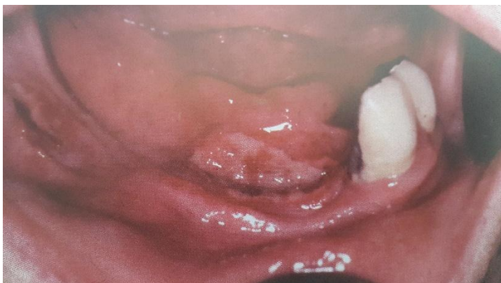
Slika 8. Dekubitalni ulkus. Preuzeto: (17)

Kortikosteroidi mogu izazvati pojačanu osjetljivost na infekcije, aktivaciju kroničnih zaraznih žarišta (TBC), te usporiti cijeljenje rana. (11)