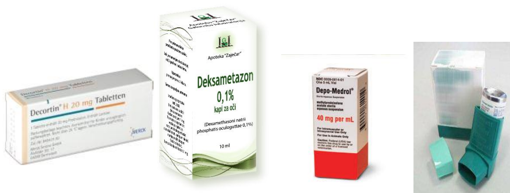
Slika 2. Kortikosteroidni lijekovi s različitim načinima primjene.

Prirodni kortikosteroidi i njihovi derivati brzo se i potpuno apsorbiraju nakon peroralne primjene; biološki aktivan dio se brzo i razgrađuje u jetri, a izlučuje se urinom. Mogu se primijeniti i topikalno (kreme, masti) i inhalacijom (pumpice za bolesti dišnih puteva). (11)