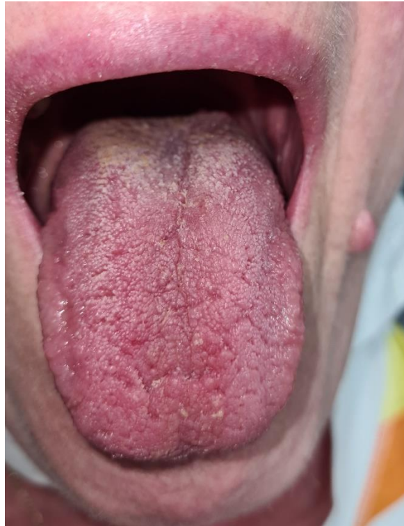
Slika 3. Suhoća usta kod bolesnice sa Sjögrenovim sindromom.

tijekom noći kada i u zdravih ljudi je lučenje sline smanjeno. Od velike je važnosti održavanje izvrsne oralne higijene zbog povećanog rizika od nastanka karijesa zbog manjka protoka sline.