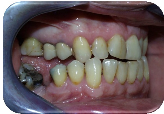
Slika 4. Bukalno nagnuti donji kutnjaci uslijed makroglosije. Tete â tete zagriz.