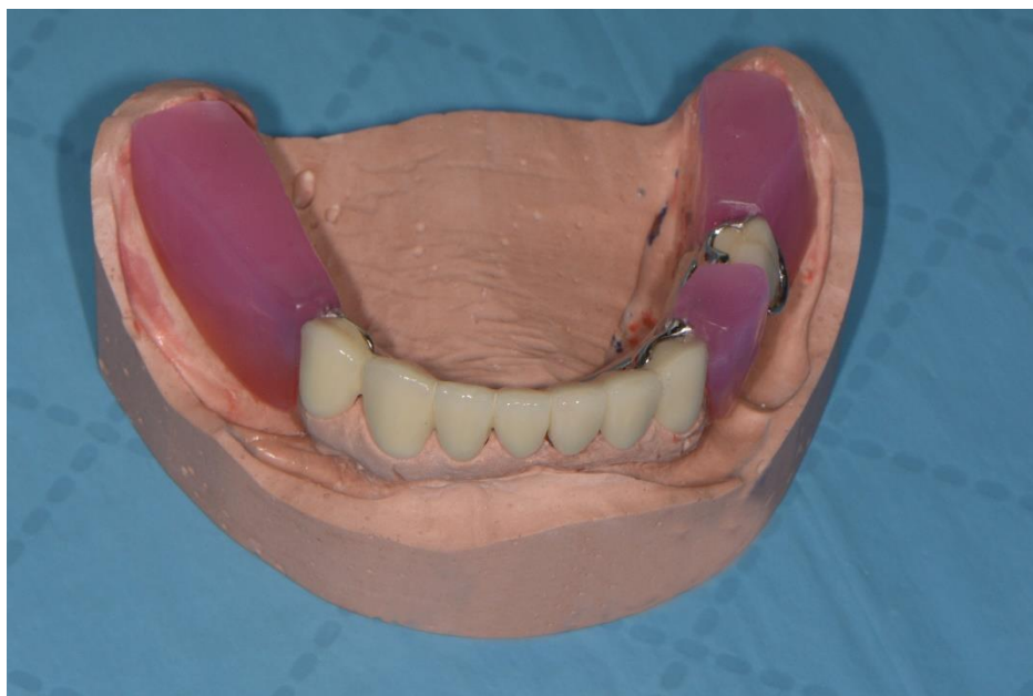
Slika 1. Nagrizni bedemi na metalnom skeletu kombiniranog rada; donja čeljust.

sastoje od akrilatne baze te voštanih nagriznih bedema. Baza šablone prekriva ležište buduće proteze dok vosak imitira zube i resorbirani greben. Bedemi se rade do visine preostalih zubi. Ukoliko je u kontri potpuna bezubost, bedemi su visine 8-10 mm za donju šablonu te 10-12 mm za gornju šablonu. Bedemi se postavljaju na sredini alveolarnog grebena. Jedino u području gornje fronte dozvoljeno je odstupanje prema anteriorno zbog estetskih potreba pa je vestibularna ploha gornjeg nagriznog bedema udaljena 6-9 mm od papillae incisivae .