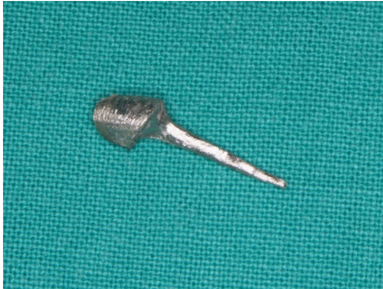
Slika 7. Individualna lijevana nadogradnja.