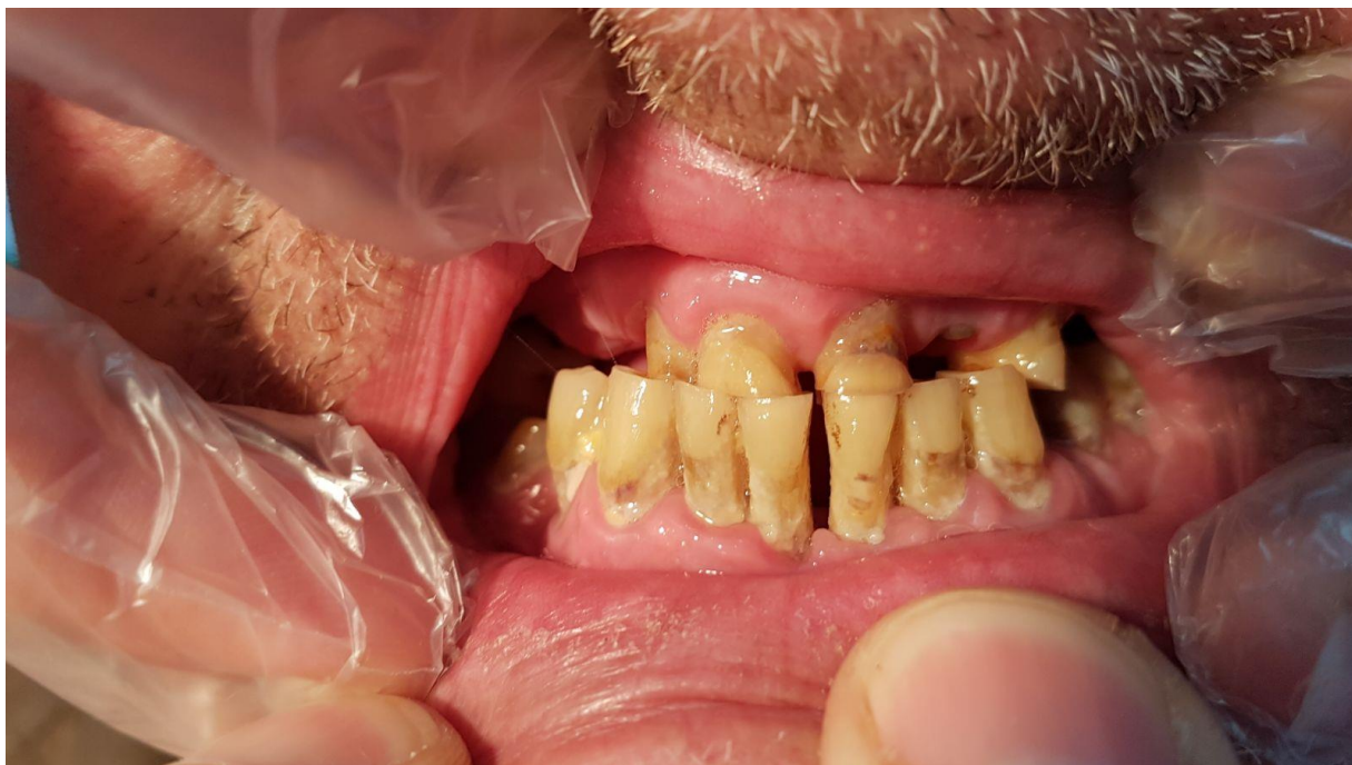
Slika 3. Zapuštenu oralnu higijenu ovisnika o alkoholu i pušenju

Manjkavo samopouzdanje, depresija i nedostatak motivacije mogu negativno utjecati na pacijentove sposobnosti provođenja oralne higijene i redovito posjećivanje stomatologa (9).