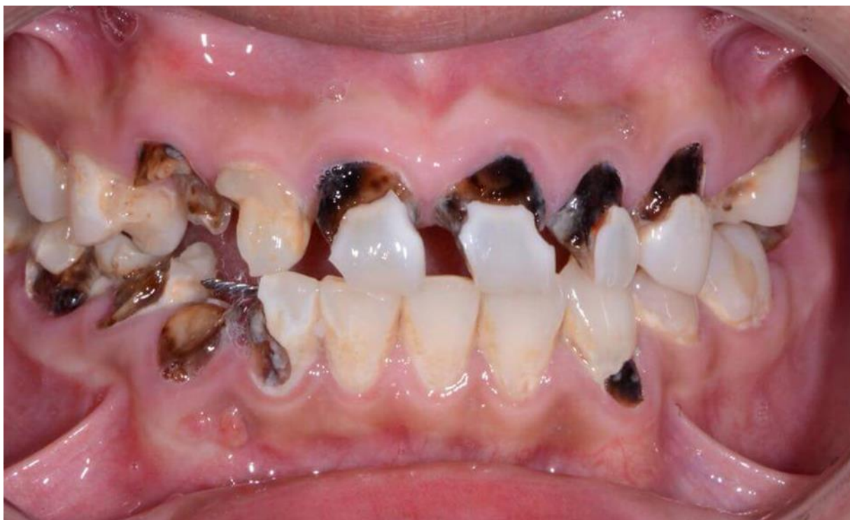
Slika 4. Karijesna oštećenja u ovisnika.

Nalaz u ustima koji bi kod stomatologa trebao pobuditi sumnju na ovisnost o drogama uključuje brzo i neobjašnjivo propadanje zuba zahvaćenih karijesom u mlađih osoba te netipičnu lokalizaciju karijesa (slika 4.) – lokalizacija na mjestima podložnima samočišćenju kao što su bukalne plohe i opsežne destrukcije aproksimalnih ploha prednjih zubi (11).