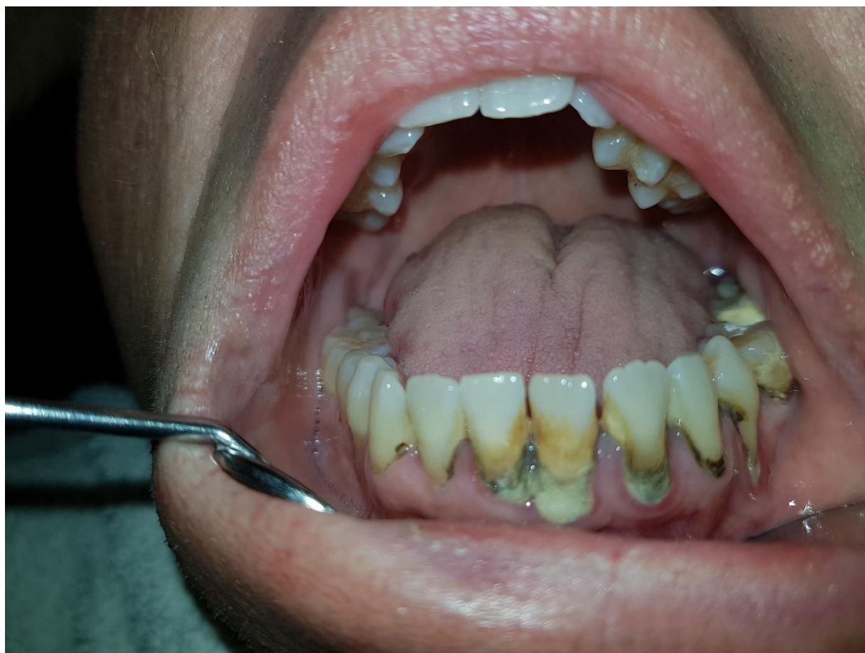
Slika 6. Uznapredovala parodontna bolest. Ovisnik o pušenju i alkoholu.

Kod parodontitisa dolazi do uništenja pričvrstnog aparata zuba. Zubno meso se odvaja od zuba, nastaju tzv. parodontni džepovi koji bivaju inficirani bakterijama i toksinima. Oni razaraju vezivnotkivni pričvrstak, te dolazi do resorpcije kosi, rasklimavanja i ispadanja zubi. Parodontitis je karakteriziran povlačenjem gingive, stvaranjem dubokih džepova između gingive i zuba, promjenom položaja te klimanjem i pomicanjem zuba (slika 6.).