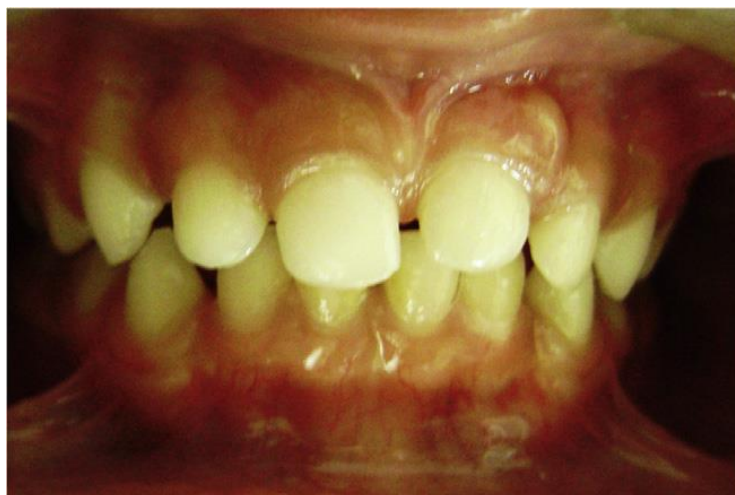
Slika 4. Re-erupcija zuba 61 nakon intruzije. Preuzeto iz (7).

Jedna od najtežih komplikacija ozljede je infekcija, ali odluka o antibiotskoj terapiji temelji se na iskustvu kliničara (51). Praćenje ozlijeđenih zuba mliječne denticije kliničko je i radiološko u vremenskim intervalima: nakon 1. tjedna kliničko, za 3 do 4 tjedna kliničko i radiološko, nakon 6 do 8 tjedana kliničko, nakon 6 i 12 mjeseci kliničko i radiološko te svake godine do erupcije trajnog nasljednika (11).