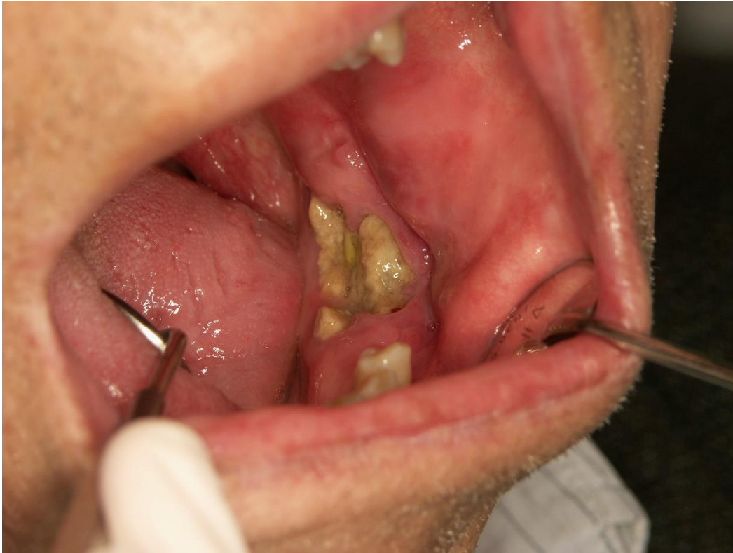
Slika 4. Stadij 2. MRONJ.

Stadij 3. karakterizira pojava eksponirane, nekrotične kosti ili fistule iz kosti te pojava boli i infekcije uz prisutnost barem jednog od sljedećih znakova: patološka fraktura, ekstraoralna fistula, oroantralna/oronazalna komunikacija i osteoliza koja se proteže sve to donjeg ruba mandibule ili do dna sinusa (17).