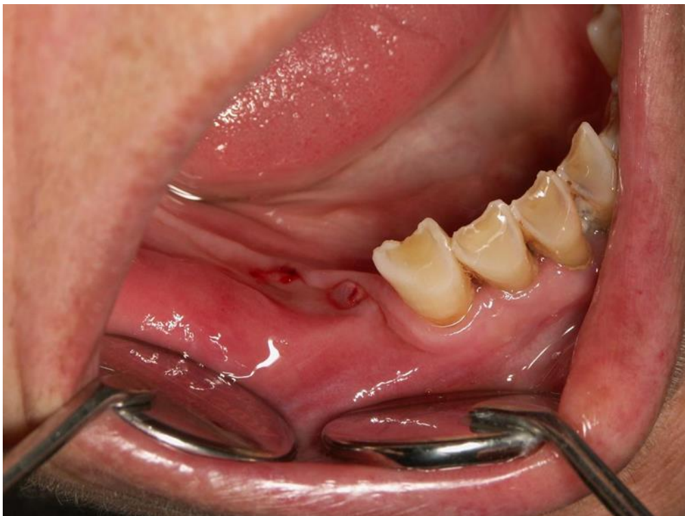
Slika 2. Stadij 0. MRONJ.

Stadij 0. predstavlja preteču pravoj bolesti. Kategorizira pacijente koji su izloženi riziku, ali s nespecifičnim simptomima te nespecifičnim kliničkim i rendgenskim znakovima.